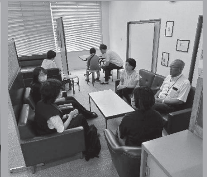
▲「ゆるトーク」(わかサポ)

中学校在籍中は、さまざまな支援を受けることができます。登校支援や、スクールカウンセラー、スクールソーシャルワーカーなど、必要に応じて活用することができますよね。しかし、中学校を卒業した途端に、それらの公的な支援は途切れてしまうのです。私たちはそれを「十五歳の壁」と呼んでいます。その壁を作らないようにするために力を注いでいます。例えば、社会復帰のためのサポートとして、「ゆるトーク」や「ボランティア部」などの居場所づくり活動を実施しています。また、各中学校のF組への訪問を行い、生徒と他愛のない会話をしながら卒業後もつながる関係づくりを目指しています。そして、定期的に街頭補導をし、少年への声掛けや「わかサポ」の周知をしています。 誰一人取り残さずに支援を続けていきたいと思っています。