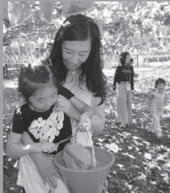
▲学区ふれあい遠足 「ぶどう狩り」(常磐東小)