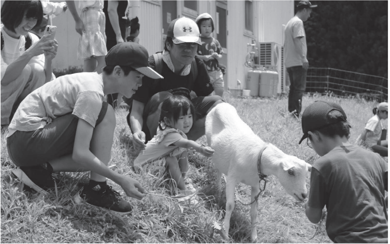
▲YAMABIKO 食堂のイベントで周りの人に見守られながら、ヤギと触れ合う子供(下山学区地域づくり協議会)

令和五年四月、「こどもまんなか社会」の実現を目指し、こども家庭庁が発足した。岡崎市もその趣旨に賛同し、八月に「こどもまんなか応援サポート」を宣言している。