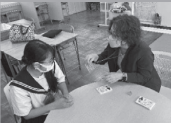
▲わかサポのF組訪問(南中)