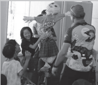
▲かかしづくりイベント(下山)