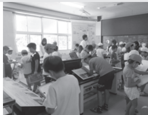
ホテル学校での環境学習

取組の例 市民スポーツ大会 / 動物愛護教室 / 生徒市議会 / こどもまつり / ブックスタート / かがくフェスタ / 少年自然の家 / ホテル学校 / おかざき自然体験の森 / 自然観察会 / 理科作品展 / タブレット型情報端末導入 / 地球温暖化防止隊 / 親子造形センター