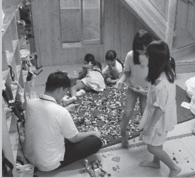
▲放課後児童クラブ (第2太陽クラブ)