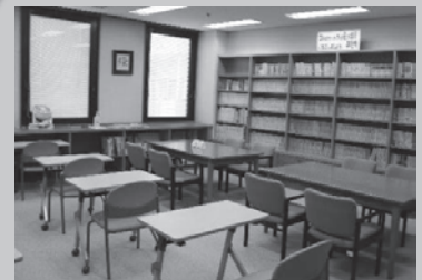
▲子供が読書や学習などで利用できる、開放されたスペース (高年者センター岡崎)