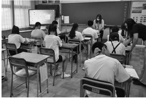
プレクラスの朝の学習風景

開室から現在まで、プレクラスの卒業生の出身国は八か国にも及ぶ。日本語教育講師の通訳だけでは間に合わない状況である。翻訳機やアプリの進歩は目覚ましいが、翻訳に時間がかかる言語もある。正しい翻訳かどうか疑わしい場合もある。翻訳した日本語が表示されるアプリならば、何回もチャレンジできるが、そうではないアプリは誤訳の危険度が高まってしまふ。同音異義語が