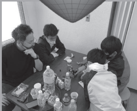
▲F組生徒のわかサポ訪問(福岡中)