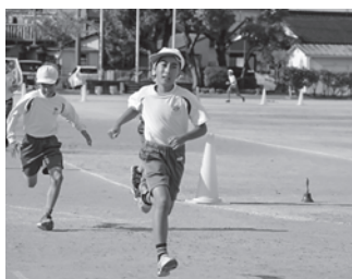
▲持久走記録会(六ツ美北部小)

通学班に、いつもとは違った様相が見られる。「今日は修学旅行なので僕が班長です」と五年生。何度も振り返りながら下級生の様子を見て歩く姿が、初々しくも頼もしい。 色めく木の葉に、季節の移ろいを感じる秋。もの寂しげな雰囲気の中にも、次代に向けて動き出すエネルギーが確かに潜んでいる。