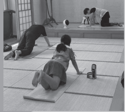
▲定期教養講座「やさしいヨガ」 (中央地域福祉センター)