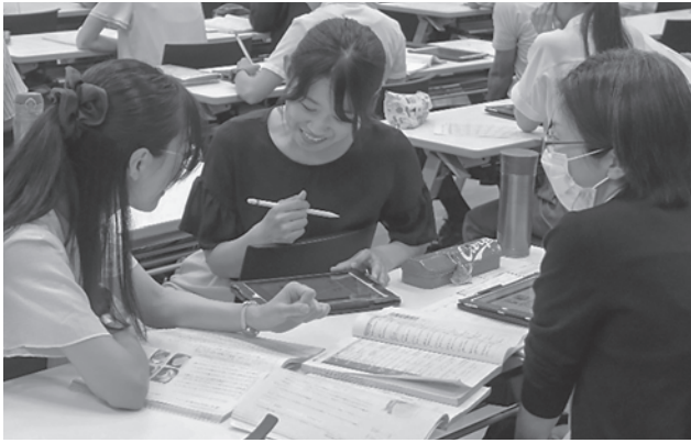
▲教師の力量向上への取組(教師力アップセミナー【基礎編】国語)