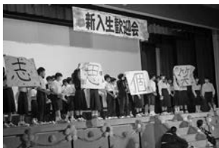
▲「新入生歓迎会」 新入生歓迎会(矢作北中)

ツバメが本宮山を越えて飛来する。風光る青空を滑り下りる姿は胸がすく。次々に並んで羽を休め、さえずる姿は愛おしい。 新学期、新しい学級に足を踏み入れる子供たちを温かく迎え、その期待に応えていきたい。子供たちの健やかな笑顔が続く、学級づくりを始めよう。