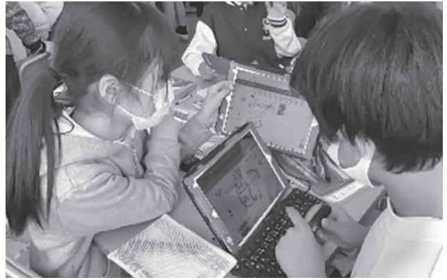
▲ICTを活用した、思考の共有や整理、可視化(六ツ美北部小学校)

きる「思考力・判断力・表現力等」の育成③学びを人生や社会に生かそうとする「学びに向かう力・人間性の涵養」さらには、子供たちが「どのような学ぶか」に着目して、学びの質を高めていくためには、「主体的・対話的で深い学び」の実現を目指した「アクティブラーニング」の視点から授業改善の取組を活性化していくことが必要であるとされている。