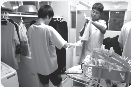
▲自分たちで協力して行う洗濯

五十年もの長きに渡り、生徒の生活と自立を支えてきた額田中学校敬信寮。多くの寮生に愛された敬信寮が、今年度末で閉寮を迎える。 昭和四十七年に豊富中、宮崎中、形埜中、下山中の四校が統合され、額田中学校が誕生した。その翌年に誕生したのが、額田中学校敬信寮である。大雨河、千万町、形埜、下山校区の生徒が入寮地域に指定され、開寮時には一九六名が入寮した。「家族と離れる寂しさはあったが、きれいな寮の部屋やホールで、みんな話をするのがとても楽しかった」と、当時の寮生は語る。開寮当時は、寮内に理容室や売店も設置されていた。 平成九年度から寄宿舎の大改修が行われ、現在の敬信寮となった。部屋が新しくなり、三人部屋から六人部屋となった。広いベッド、エアコンによる冷暖房完備、ホールへの自販機設置など、寮生にとってより過ごしやすい環境となった。 最大二三〇名いた寮生も、今や五十六名。しかし、生活は昔と変わらない。勉強時間が決められており、集中して机に向かう。自由時間は卓球をしたりテレビを見たりと、各々楽しむ。食事の準備や片付け、洗濯、おやつなどの配付など、寮生役員が中心となり、自治的な活動が行われている。「寮のよいところの一つは、先輩・後輩がともに過ごすところだ」と、寮生は言う。生活の仕方について先輩から学ぶことはもちろん、仲間とともに過ごすことで心遣いも学ぶ。さらに、仲間だけでなく多くの人に支えられていることも知る。 「人を敬い、人を信じる」。その人となりや中学生同士で磨きあげる場所であった敬信寮。寮がなくなろうとも、敬信の心は、巣立った生徒から後輩たちへ受け継がれていくだろう。