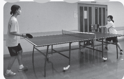
▲友達と楽しむ休み時間