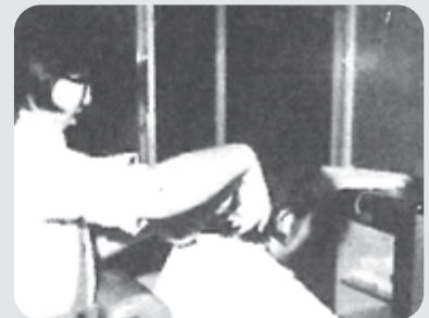
▲出張理容室の様子