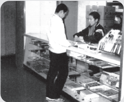
▲寮生による委員会で運営する売店