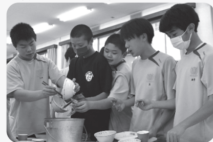
▲異学年生徒が協力する食事の片付け