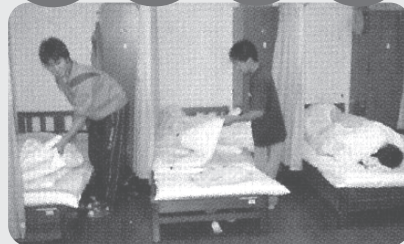
▲新しくなった寝室