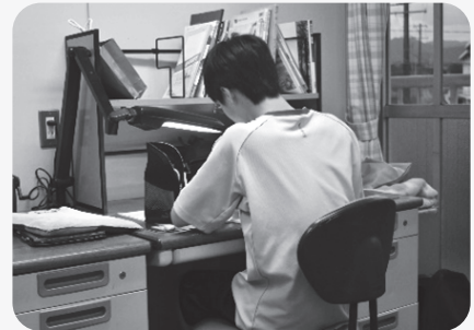
▲集中して行う勉強