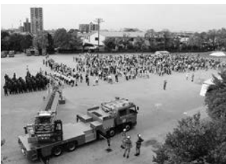
▲地域防災訓練(大門小)

保護者に代わり、約二十年に渡って敬信寮生を支えてきた寮母さんがいる。写真を撮らせてほしいと伝えると、「みんなで撮ろう」と。たちまち寮生が寮母さんの周りを囲み、最高の笑顔を見せた。敬信寮がなくなる。人を敬い、信じるこの価値を学べる敬信寮が岡崎市にあったことを、多くの人の心に留めておいてほしい。