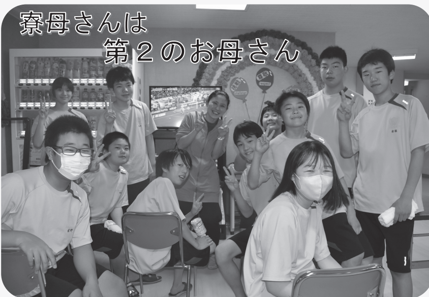
▲寮生活を支えている寮母さんを囲む寮生たち