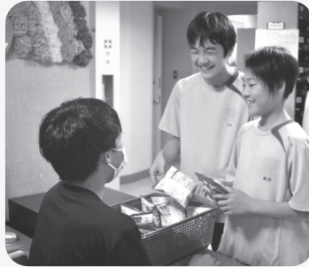
▲夕食後のおやつ配付