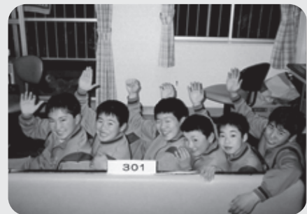
▲1、2、3年生と一緒に暮らす部屋