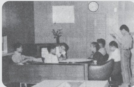
▲ホールでの団らん