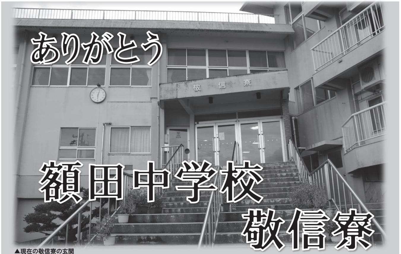
▲現在の敬信寮の玄関

五十年もの長きに渡り、生徒の生活と自立を支えてきた額田中学校敬信寮。多くの寮生に愛された敬信寮が、今年度末で閉寮を迎える。 昭和四十七年に豊富中、宮崎中、形埜中、下山中の四校が統合され、額田中学校が誕生した。その翌年に誕生したのが、額田中学校敬信寮である。大雨河、千万町、形埜、下山校区の生徒が入寮地域に指定され、開寮時には一九六名が入寮した。「家族と離れる寂しさはあったが、きれいな寮の部屋やホールで、みんな話をするのがとても楽しかった」と、当時の寮生は語る。開寮当時は、寮内に理容室や売店も設置されていた。 平成九年度から寄宿舎の大改修が行われ、現在の敬信寮となった。部屋が新しくなり、三人部屋から六人部屋となった。広いベッド、エアコンによる冷暖房完備、ホールへの自販機設置など、寮生にとってより過ごしやすい環境となった。 最大二三〇名いた寮生も、今や五十六名。しかし、生活は昔と変わらない。勉強時間が決められており、集中して机に向かう。自由時間は卓球をしたりテレビを見たりと、各々楽しむ。食事の準備や片付け、洗濯、おやつなどの配付など、寮生役員が中心となり、自治的な活動が行われている。「寮のよいところの一つは、先輩・後輩がともに過ごすところだ」と、寮生は言う。生活の仕方について先輩から学ぶことはもちろん、仲間とともに過ごすことで心遣いも学ぶ。さらに、仲間だけでなく多くの人に支えられていることも知る。 「人を敬い、人を信じる」。その人となりや中学生同士で磨きあげる場所であった敬信寮。寮がなくなろうとも、敬信の心は、巣立った生徒から後輩たちへ受け継がれていくだろう。