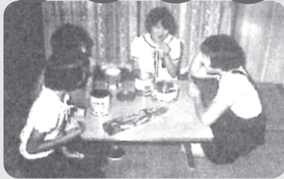
▲寮生の部屋での団らん