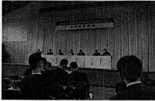
11月18・19・20日 場所(山口県) 10月21・22日 場所(金沢市)

第二十二回全放送大会が「教育のシステム化をめざすなかで放送の役割をたしかめよう」という主題で金沢市で開かれた。今大会は豊かな人間を育てるために、放送をとり入れた「教育のシステム化」を考え、その実践をとおり、「放送の役割」をたしかめようという