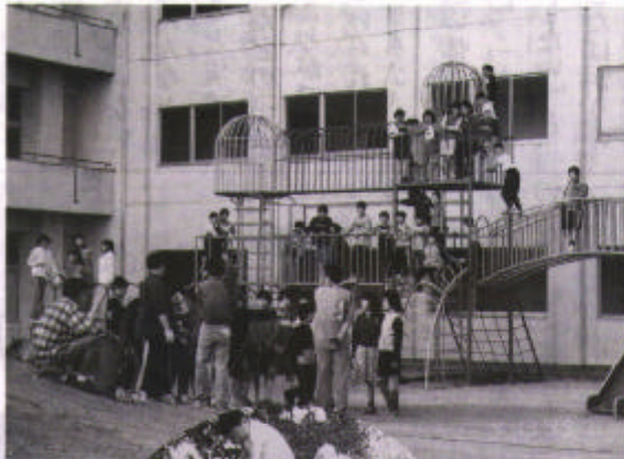
▶レインボータワー (上地小)