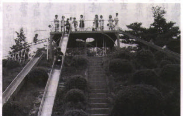
▲連尺ランド (連尺小)