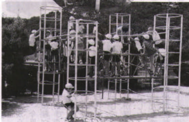
▲コンビネーションジム (本宿小)