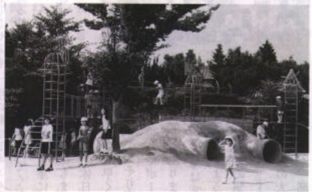
▲小豆坂ランド (小豆坂小)

今日から二学期がスタートした。しばらくの間静かだった運動場に、遊具で遊ぶ子供たちの声が、また返ってくる。