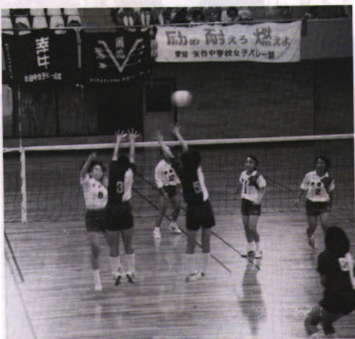
▲市長杯総合体育大会—バレーボール女子の部