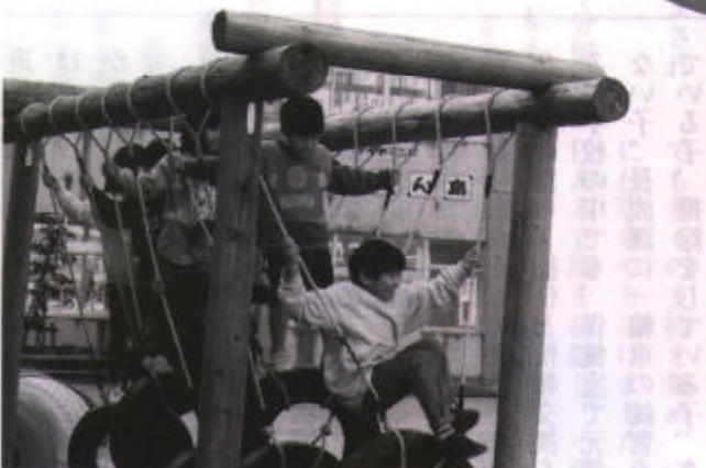
▲タイヤ渡り（六ツ美北部小）