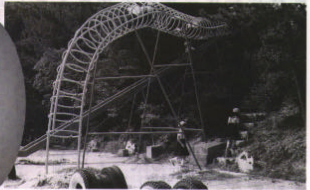
▲宇宙リング (井田小)