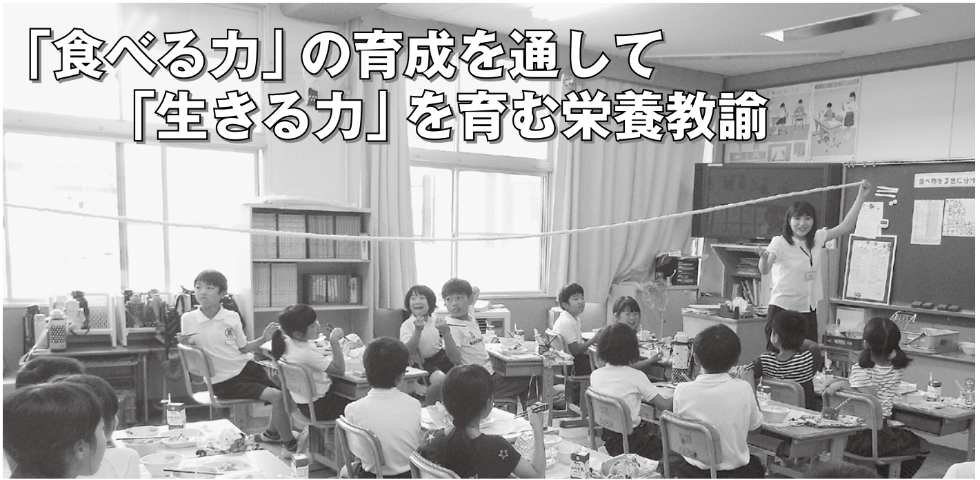
▲ 給食巡回訪問で腸の長さ（8m）を体感する児童（奥殿小）