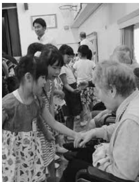
いつまでも元気でいてね～敬老会～ (矢作北小)

作り手の思いを伝えたいと、栄養教諭の計らいで、センターの調理員による学校訪問が実現した。作る側と食べる側、食を通して心がつながる。 約一年半前から給食の献立作りが始まる。心と体の健やかな成長を願う多くの人の思いを子供たちに伝えたい。