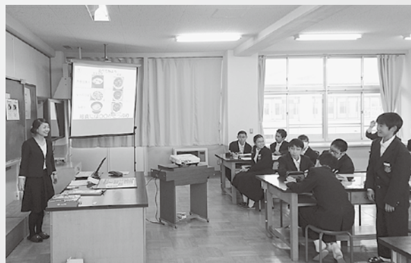
▲ 給食の献立の工夫を考える家庭科の授業（福岡中）

朝ご飯を食べることで、脳や体にエネルギーが補給され、学力や体力がアップされる話などは、生徒たちにとって身近な話題で興味深いものでした。