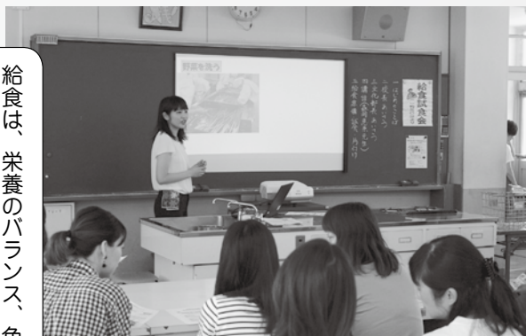
▲ 保護者向け給食試食会での講師（岩津小）