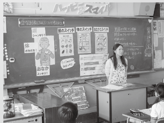
▲ 野菜の大切さを考える特別活動の授業（福岡小）