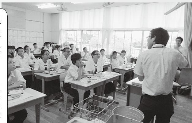
▲ 朝食の大切さを伝える給食前後での巡回訪問（城北中）