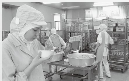
▲ 味の確認、安全の確認

給食を作る際には、作業手順を確実にを行うように気を付けています。子供たちが食べる、調理してから2時間後の味を考えると、塩分摂取量が多くなるように薄めの味付けを心がけています。