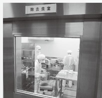
▲ 除去食室内での調理

アレルギーがある子供が、隣の席の子とできるだけ同じようなものを食べられるように給食を作っています。調味料の割合をよく考えて、特定の食材を除いてもおいしくなるようにしています。