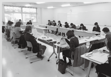
▲ 給食献立作成委員会

各校の給食主任から学校の様子を聞き、よりよいものになるように献立を考えています。給食をおいしく食べてもらえることを第一に考えています。