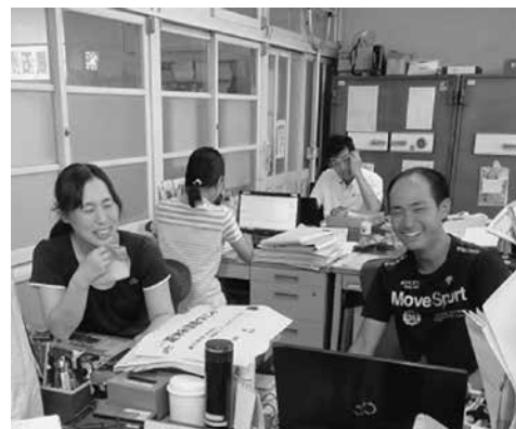
▲ 先輩との会話で心が軽くなる

E 年齢の近い先輩の先生方が気さくに接してくださって楽しく過ごることができています。同じ教科の先生方も必ず声をかけてくださいます。拠点校指導員の先生は、指導案を書くとき、分かりやすく指導してくださいました。不安なときには、相談にのってくださいの方がたくさんいます。