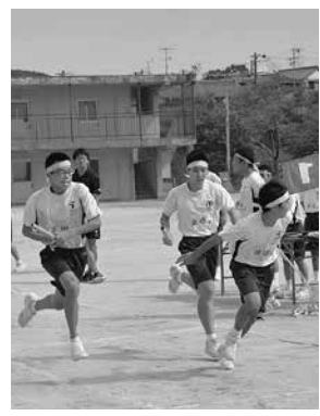
接戦〜体育大会・リレー〜 (東海中)

ツクツクボウシの声が響く。セミの合唱もそろそろ聞き納め。学校に響く声の主はセミから子供に入れ替わる。体育大会とその応援練習に力のこもった声が響く。協議し計画する力、分担し協力する力、認め合う力、耐える力を育む行事にしたい。