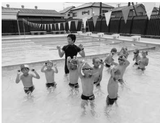
▲子供とともに「ぶかぶか星人からの試練」へ挑む

A 二年生の水泳の授業で、浮けるようになるために「水星人になろう」という目標を示しました。「ぶかぶか星人からの試練」という目標に、子供たちが楽しく取り組んでいます。