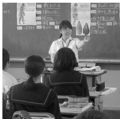
▲ 指導員や同僚に学び次第に笑顔が増す