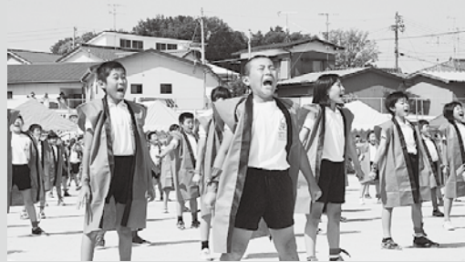
▲ 家康公遺訓を唱える運動会の演技 (井田小学校) 3・4年生が「一天壽快」を踊り、家康公遺訓を全員で唱えて演技した。