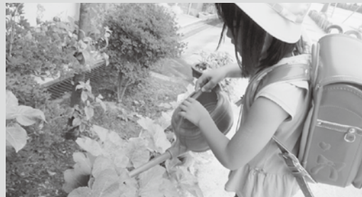
▲ 葵の栽培 (大樹寺小学校) 長年「家康学習」を進める大樹寺小学校は、「二葉葵」や「立ち葵」の栽培にも取り組む。下賀茂神社より譲り受けた「二葉葵」の栽培には、葵中学校も取り組む。