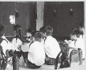
(北中学校) の地 (岡崎城・伊賀八幡 神社)を訪れて、学習した。

時間等に関連付けて家康公について 学区に伝わる史実を題材としたり、 行ったり、興味深い取り組みが多い。 学校も多数ある。城南小学校では6 「バル」で独自の家康公検定を作成し は、社会科で「久保城の密談」を学 校では、文化祭で上演する南中劇で