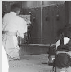
▲ 菅生神社の訪問 1年生が家康公ゆ 宮・大樹寺・菅生神社・