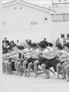
▲ 関ヶ原の合戦を表 5・6年生が学区の いての史実を基にした