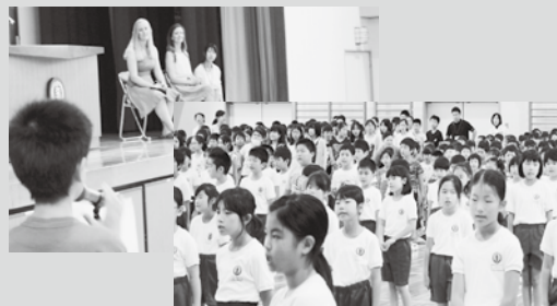
▲ 「家康公遺訓」でニューポートビーチ使節団を歓待 (小豆坂小学校) 全校で「家康公遺訓」の暗唱に取り組む同校は、訪れたニューポートビーチ使節団の代表に暗唱を披露した。