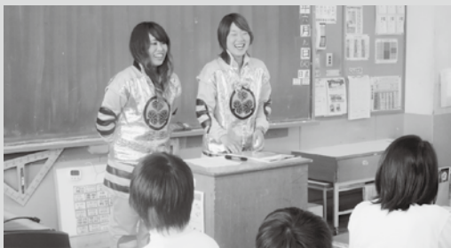
▲ 「四百年祭ワークショップ」(根石小学校 他多数) 市観光課主催「四百年祭ワークショップ」で、おかざきPR隊(吉本興業芸人)によるクイズやかるた遊びを通して家康公について学んだ。

運動会や総合的な学習の学びを深める学校がある生徒が主体的に追究活動を2学期以降に、学習する年生が「城南CITYカーニバル」を実施する。宮崎小学校で習する予定である。南中学「竹千代の母」を取り上げる