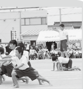
した組立体操 (矢作北小学校) 長瀬八幡宮に残る家康公につ 物語を表現し、演技した。