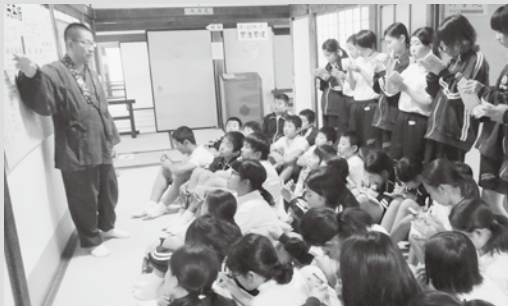
▲ 大樹寺の訪問 (常磐中学校) 1年生が総合的な学習の時間に「岡崎の家康遺産～家康公が残した四百年～」の学習を進めている。