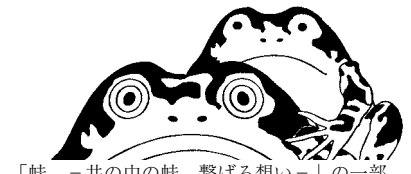
「蛙 -井の中の蛙 繋げる想い-」の一部 神尾尚宏氏作の手彫りゴム印