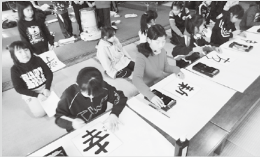
▲ 法蔵寺での書写体験 (本宿小学校) 4年生の総合的な学習の一環として、家康公が幼少時代に手習いをした法蔵寺で書写の学習を行った。