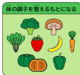
むきしつ ビタミン・無機質

好き嫌いなく栄養のバランスを整えて食べることで体に必要な栄養素をとることができ、夏バテや病気を防ぐことができます。左の図の3つのグループの食品がそろった食事を心がけましょう!