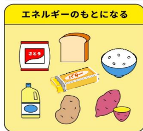
たんすいかぶつ しじつ 炭水化物・脂質