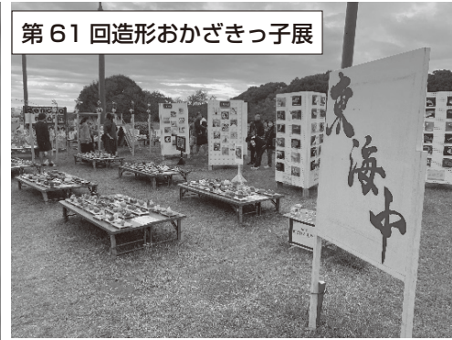
第61回造形おかざきっ子展