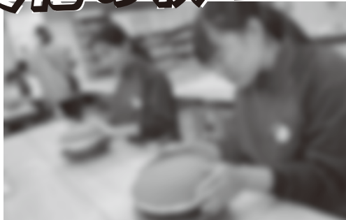
文化教養部 陶芸教室参加