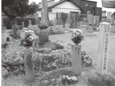
宇津（大久保）忠茂の墓