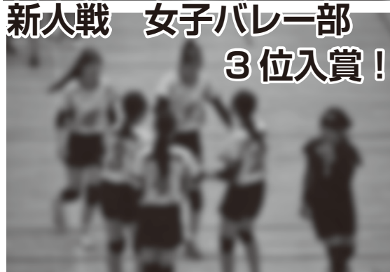
新人戦 女子バレー部 3位入賞！