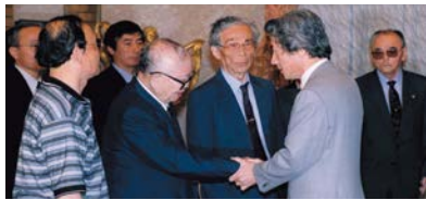
控訴断念するかどうかの最終判断をする直前に、ハンセン病訴訟原告代表と面談する小泉内閣総理大臣(当時)

熊本地裁の判決に対し、国は控訴※断念を決めるとともに、内閣総理大臣談話を発表し、ハンセン病問題の早期解決に取り組む決意を表明しました。しかし判決後も、熊本県で入所者に対するホテル宿泊拒否事件が起き、これが報道されると、今度は元患者に対する誹謗中傷が行われる事態に発展するなど、残念ながら入所者や社会復帰者、その家族に対する偏見や差別には根強いものがあります。そのため、療養所の外で暮らすことに不安を感じ、安心して退所することができないという人もいます。