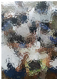
男女で教え合ったり

※そのために本校の研究についての情報を家庭・地域の方と共有したいと考え、本通信を発行しました。