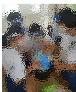
必要な教具を選んだり