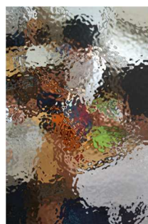
タブレットを使ったり