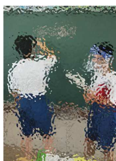
黒板で意見を広めたり