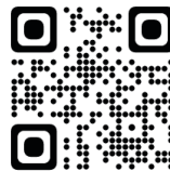
県PTAのホームページ