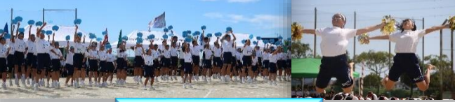
全力で輝くムッキ一生