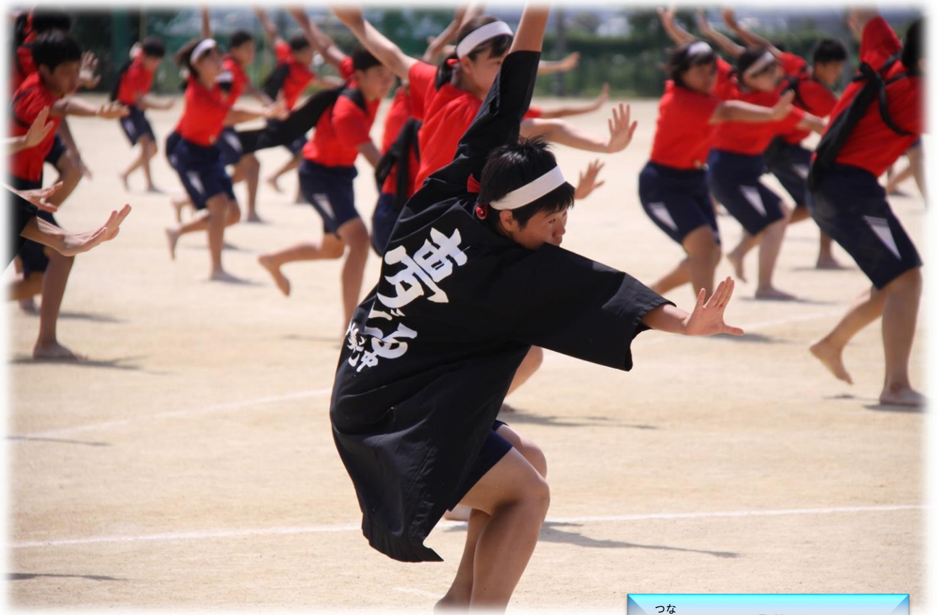
つな 繋ぐ思い「夢おどる」

問題 三角柱で \angle A = \angle D = 90^\circ \triangle ABC = 30\text{cm}^2 である。 三角柱を平面BHGで2つに分けた時 下側にできる立体の体積を求めよ。