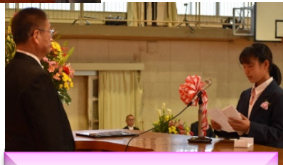
新入生 誓いの言葉