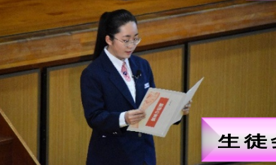
生徒会長 歓迎の言葉