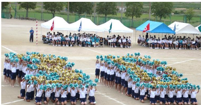
1・2年生女子リズムダンス「光華」 笑顔はじけるリズムダンス！