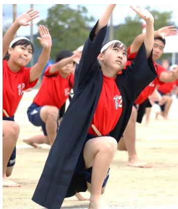
表 彰 記 録

し、はじめはばらばらで、伝統を受け継げるのかとても不安でした。それでもリーダーを中心に思いを伝え合うなど「考動」を続けました。そして、何のためか、全員の思いが同じ方向を向いたとき、私たちは一つのものを創り上げることができました。本番では、魅力的になった姿で思いをたくさんの人に伝えることができたと思います。これからも、私たちはもつと魅力的な集団を目指して生活していきます。