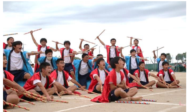
1・2年生男子演舞「熱響」 「どうだー！」にふさわしい力強い踊り！