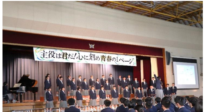
3年ハーモニーフェスティバル 11/12