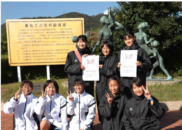
愛知県中学校駅伝大会 3位！！ 11/13