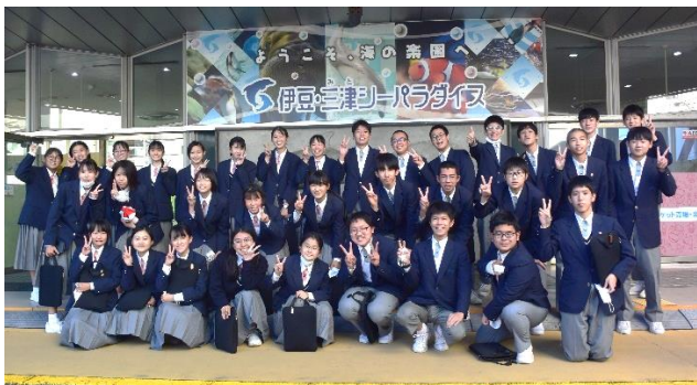
修学旅行 伊豆・三津シーパラダイス