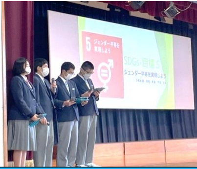
ジェンダーについて説明する3年生

お互いの違うところを個性として尊重し、認め合えるような人になりたいと思います。そのためには、小さな思いやりが大切だと考えました。私は、相手の気持ちに寄り添って会話ができるように、言葉遣いや態度を意識していきたいです。