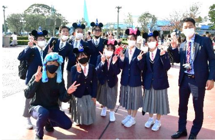
ムッキー生、ミッキー！

私たち三年生の目標である、「やってみる」を胸に、残り数か月を大切に、何事にも全力で挑んでいきたいと思えます。