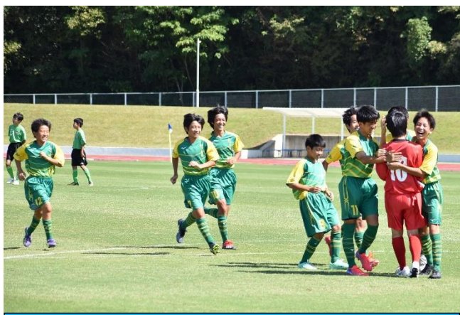
サッカー部 PK戦勝利の瞬間！ 10/2