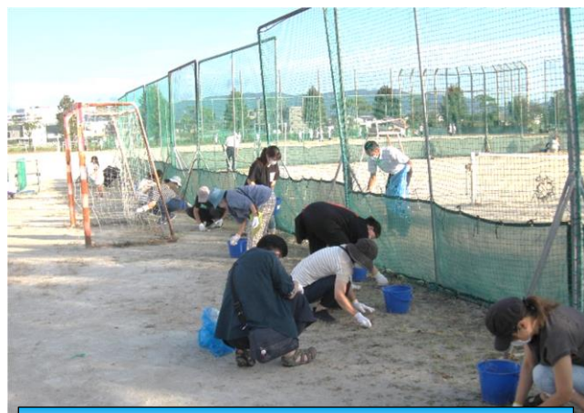
一家庭一支援（グラウンド整備） 10/8

切にこれからの生徒とともに学びを大 うに生きていく力につながります。 ができません。普段の学びはこんなふ えたり、未来を予測したりすること する中で、その変化の様子をとら る事柄を表現したりグラフにしたり のです。こんなふうに、身近に起っ う仮説を立てることはできないかとい 愛知が増え始めるのではなからう 増え始めたか分かります。千葉が この発見が、本当に法則化している 染者の増減のグラフになるのです。 を一周間ほど右にずらすと愛知の感 です。千葉の感染者の増減のグラ 後くらいに起こっているというこ 染状況は、千葉の感染状況の一週 発見をしました。それは、愛知の感 グラフを作ってみて、私は一つの ラフです。