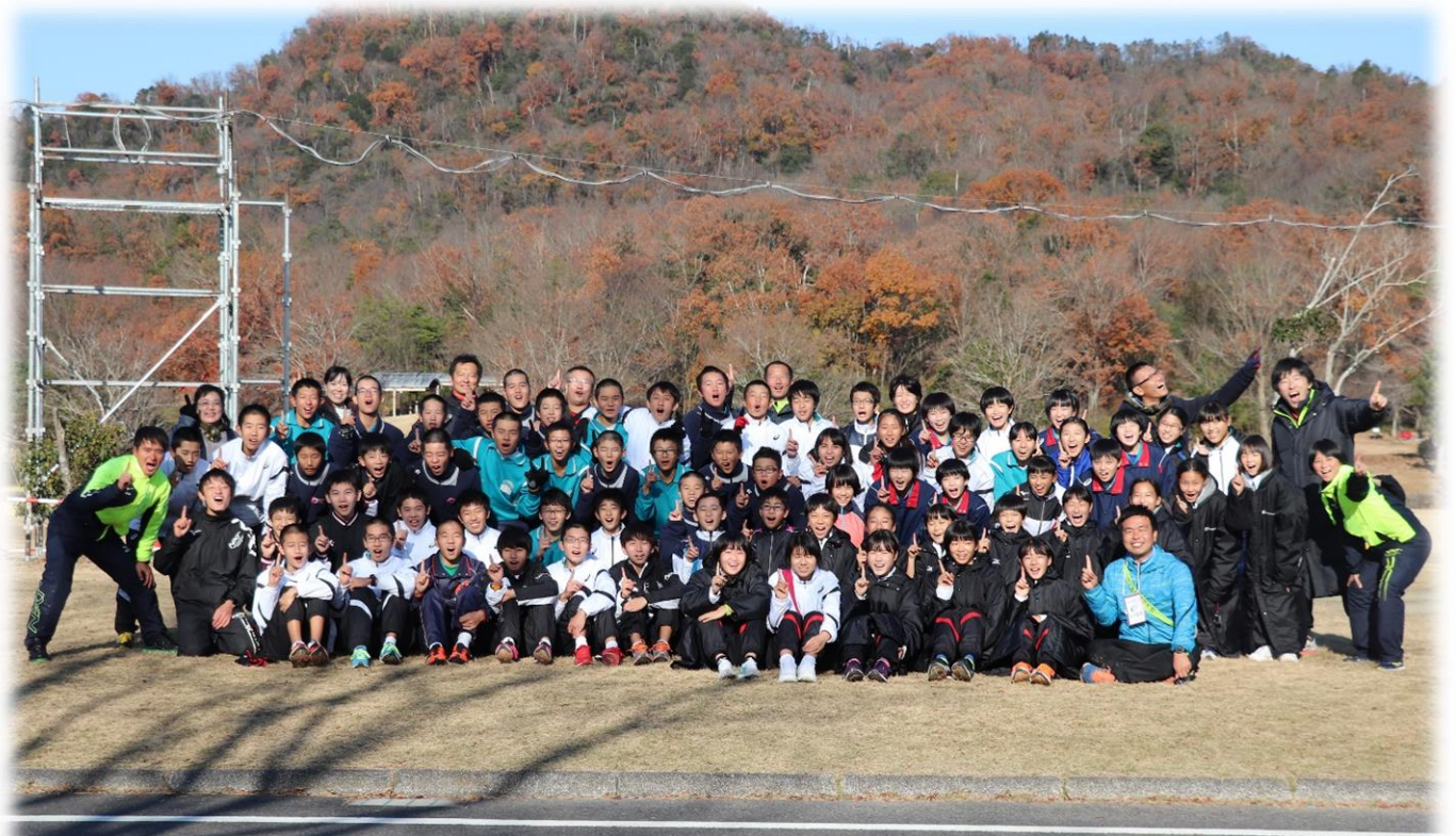
全国中学校駅伝大会 優勝（滋賀県希望が丘文化公園にて）