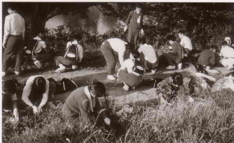
早朝草刈り (乙川堤防)