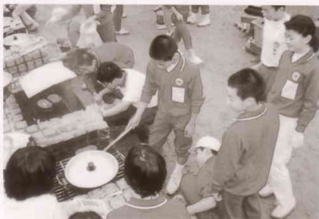
山 の 学 習 (旭 高 原 自 然 の 家)