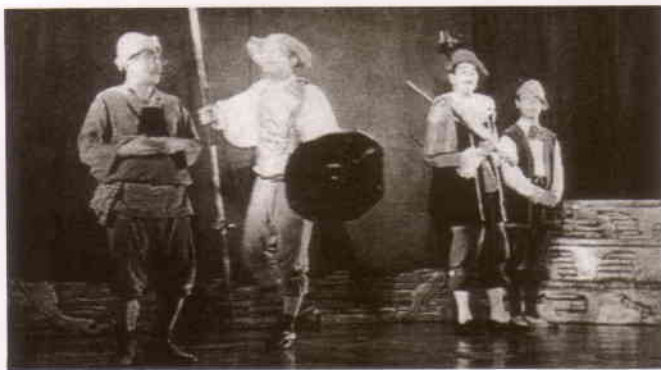
観客を魅了したプロの演技「ドン・キホーテ」