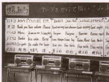
ビデオやテープを活用したコーナーが好評