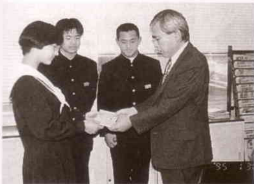
中日新聞社にて義援金を渡す生徒会役員

兵庫県南部地震被害地への義援金活動に対しては、生徒会がいち早くこれに取り組みました。わずかの期間でしたが、全校生徒・職員の募金総額は、四二万一六八六円となり、一月末に半額を市役所の窓口を通し、もう半額を報道機関を通して被災地に送りました。また、PTA活動としての義援金の募金に対しても、多くの会員の方々からお志が寄せられました。総額二万三万一千六十一円は、窓口である岡崎市PTA連絡協議会に納入了しました。