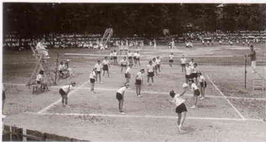
総体 バレーボール