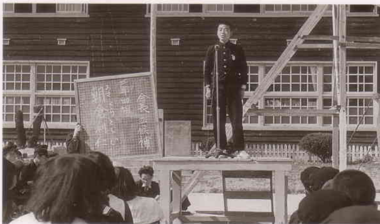
屋外での生徒会役員立会演説会