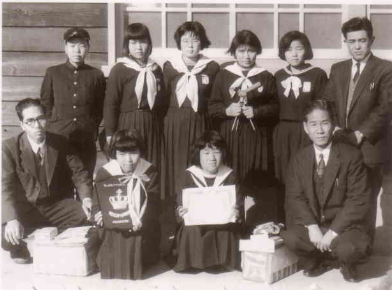
「わたしの兄妹」つづり方団体賞受賞