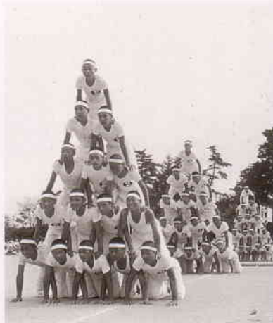
運動会（タンプリング）