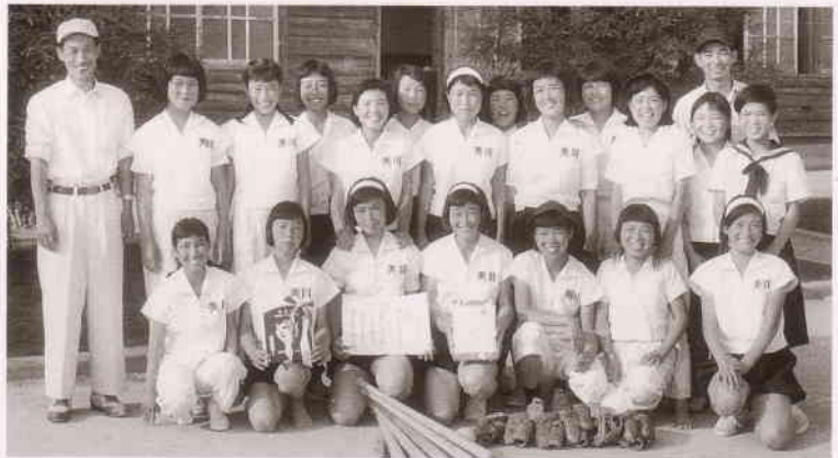
ソフトボール 市長杯優勝