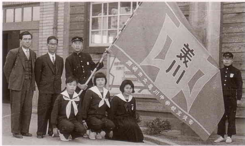
生徒会旗を迎えて