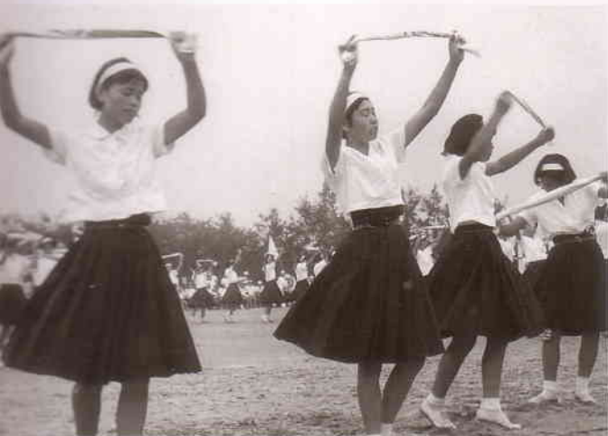
全校女子による美容体操