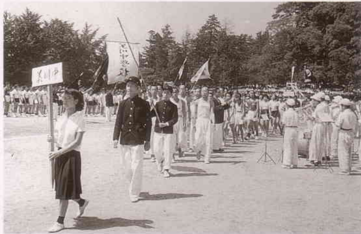
中学校10周年記念連合運動会