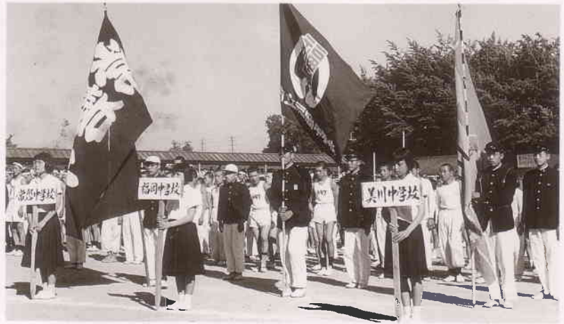
中学校総合体育大会(岡崎公園)