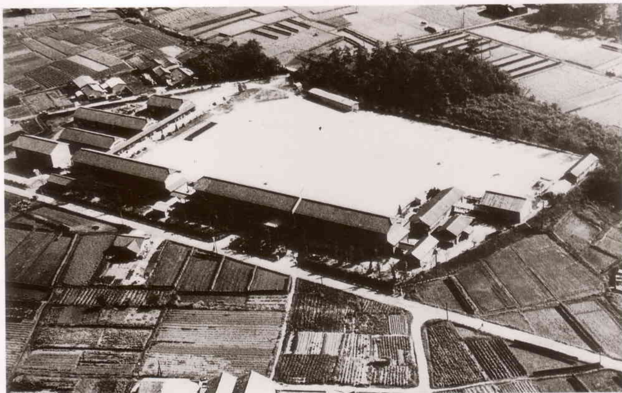
木造校舎の頃（昭和37年頃）