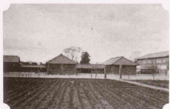
当時の美合小学校(「岡崎教育小史」より)