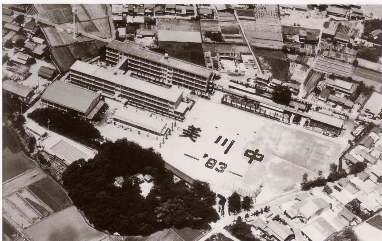
新校舎南館及び技術棟完工後（昭和58年頃）