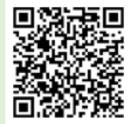
「ラーケーションの日」活動例