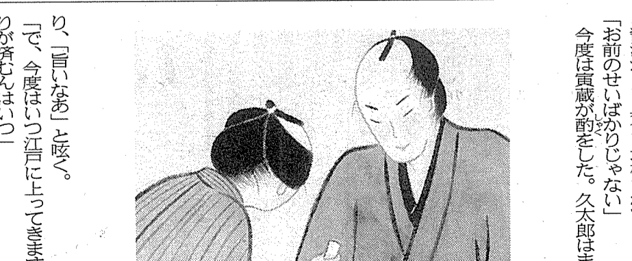
「お前のせいばかりじゃない」 今度は貞蔵が酌をした。久太郎はまた一

鶴田住職は「参拝がてら静かに楽しんでほしい」としている。まつり期間限定で本堂の拝観ができる。午前9時〜午後4時で、300円(境内のみ拝観の場合は無料)。また、駐車場の維持管理費として300円の協力を呼び掛けている。 同寺は深溝松平家の祈願所や菩提寺として、東海道本線踏切内で、24日午後1時35分ごろ、幸田町菱池のJR列車にはねられ即死した。乗客約40人けがはなかった。 事故により上下線が5本が全区間、13本が部分運休した。上下線6本で最大110分の遅延があり、約2530人の足に影響が出た。