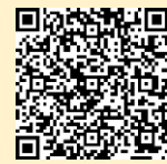
「ラーケーションの日」 ポータルサイト

※ 県の Web ページ「ラーケーションの日」ポータルサイトには、計画づくりに活用できる「ラーケーションカード」や、いろいろな学びができる場所を紹介しています。参考にしてください。