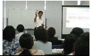
研修で熱心に聴講する先生方

7月31日に、授業力・教師力アップセミナー（基礎編）が「りぶら」で行われました。今年度の研修は、読書感想文の書き方と読書感想画の指導でした。どちらも2学期から学校の現場ですぐに使える内容で、具体的な説明で分かりやすいと、参加者にとっても好評でした。