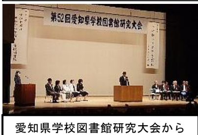
愛知県学校図書館研究大会から