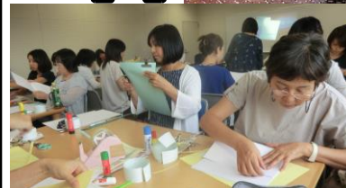
ワークショップでは絵本作り