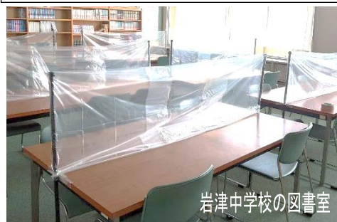
岩津中学校の図書室

大樹寺小学校は、本を読む前後の手洗い、読書の際はマスクを着用することを新しいきまりとして、ポスターやテレビ放送で周知しました。また、密を避けるため、3・4年生教室がある中舎の空き教室に書架を置き、中学年用図書を別置しました。読み聞かせは、教材提示装置等を使ってテレビ画面に映し、児童は着席のまま行いました。