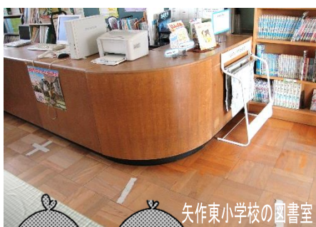
矢作東小学校の図書室

根石小学校では、各学級30冊の学級文庫を用意しました。様々なジャンルの本を手にとってもらえるよう、またその中で子供のおススメを互いに伝えられるよう、本を精選し、学級で保管しています。