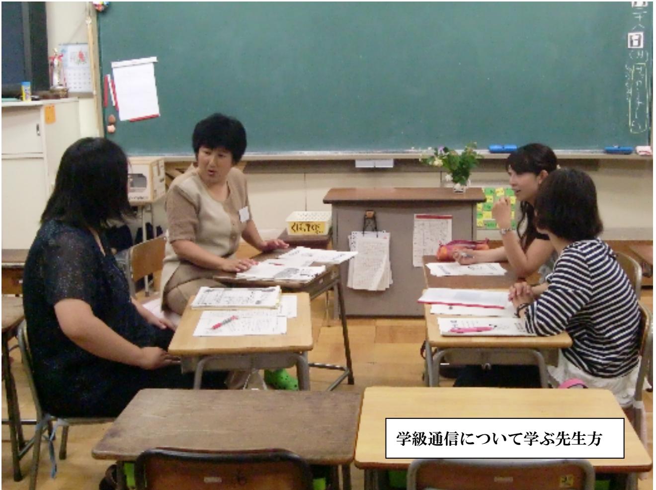
学級通信について学ぶ先生方