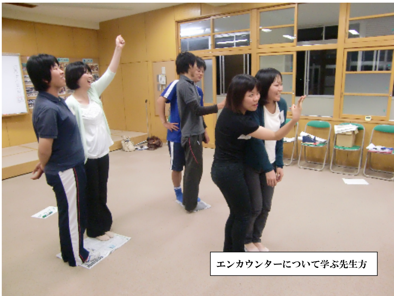
エンカウンターについて学ぶ先生方