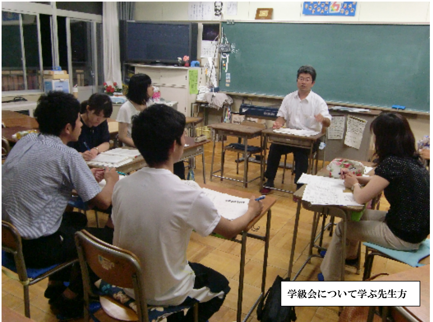
学級会について学ぶ先生方