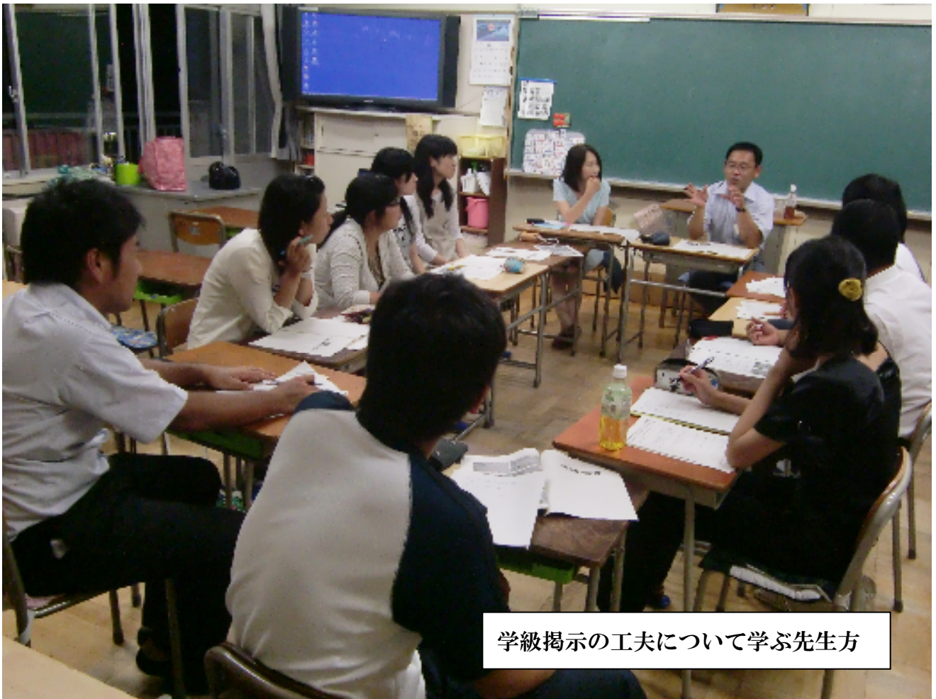
学級掲示の工夫について学ぶ先生方