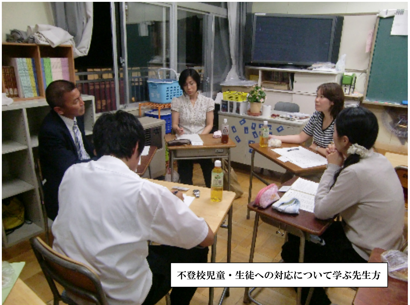
不登校児童・生徒への対応について学ぶ先生方