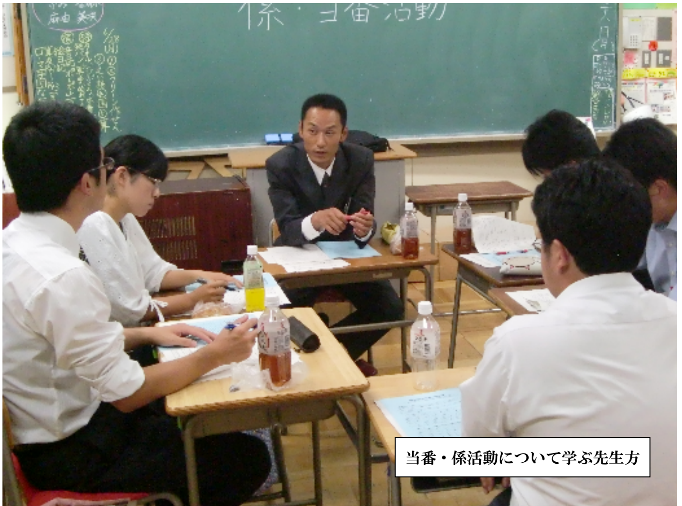
当番・係活動について学ぶ先生方