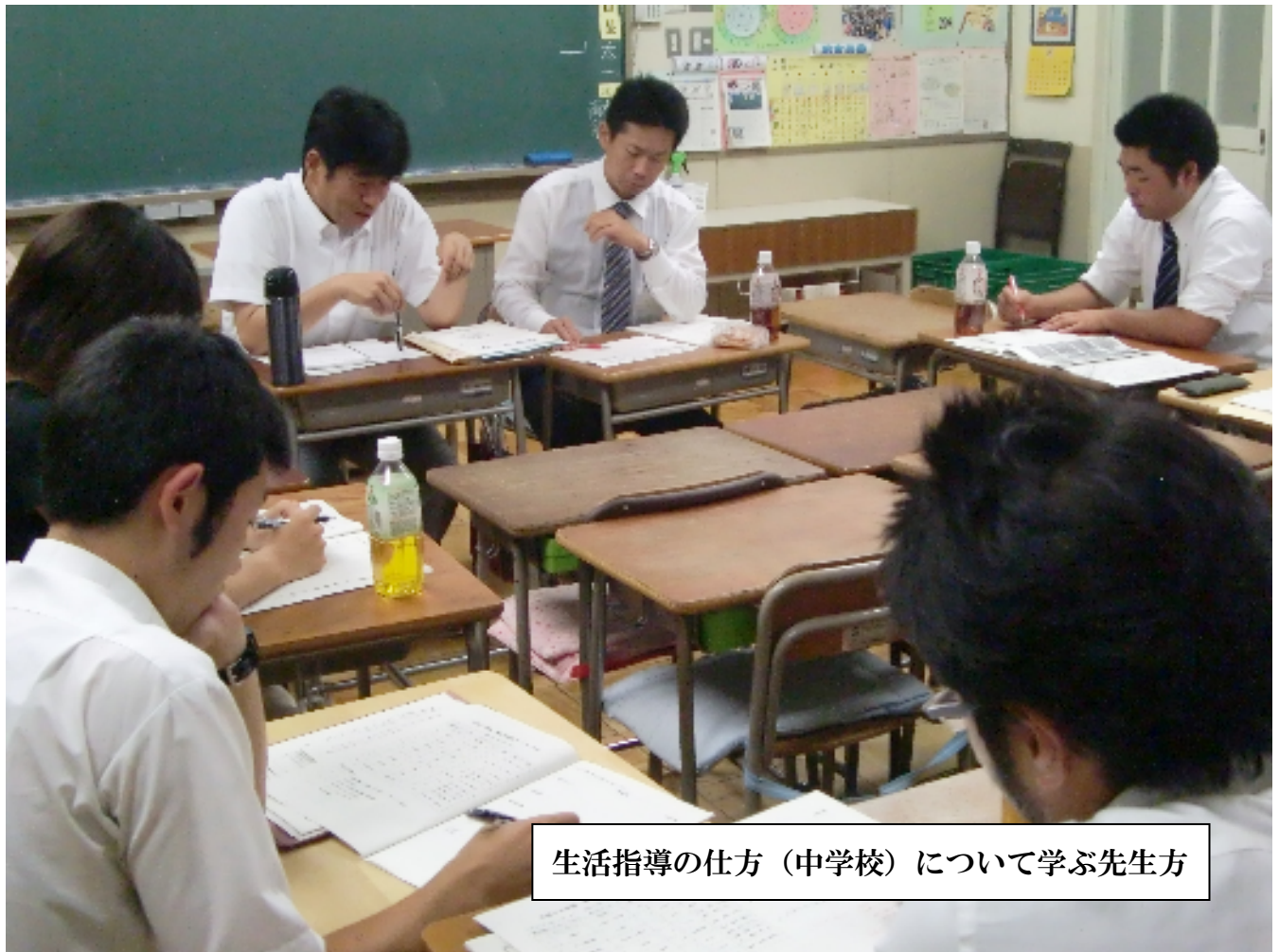
生活指導の仕方（中学校）について学ぶ先生方