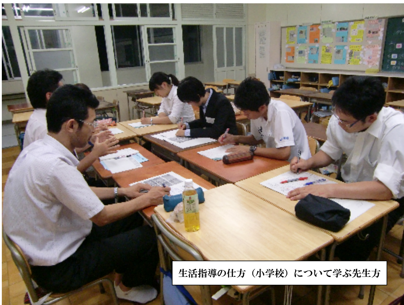
生活指導の仕方（小学校）について学ぶ先生方