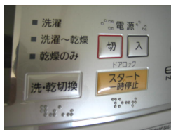
【点字が表示されている洗濯機のボタン】

(1) 点字が表示されているものの写真(エレベーターのボタン、洗濯機のボタン、酒類のアルミ缶のプルタブ付近)の写真を見て、何と表示されているか考えるようにする。