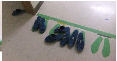
【足跡マークがあっても…】