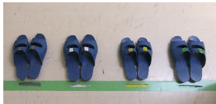
【線に揃えて並べる】

3学期からトイレのスリッパの位置を右のように廊下からよく見える場所に移動しました。みんながトイレのスリッパの状態を認識し、一人一人がいつも「次に使う人のために」揃えるようにしてほしいからです。よく気が付く特定の子供や教師がいつも揃えていては意味がありません。本校の子供ならば線が一本あれば揃えられると考えて、朝会でも説明し