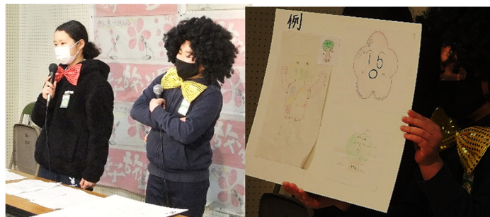
【150歳キャラクター募集の様子】

2月3日(水)の朝にMAXから放送で「梅園小学校の150歳キャラクター」の募集がありました。多くのキャラクターの原案が集まったようです。これから、どのようにキャラクターが完成していくか楽しみです。梅園小学校は明治4年2月22日に「市学校」という名称で鹿ヶ谷饗応所(俗称御馳走屋敷)に誕生しました。令和3年2月22日に150歳になります。令和3年度には、梅園小学校開校150周年記念事業を学校・地域・保護者・児童が協力して行っています。