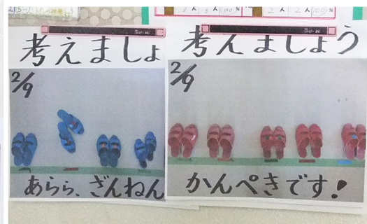
【トイレ前の掲示物：少しずつ改善されています】

ました。各学年でも子供が分かりやすいように工夫し、だんだん成果が出ているところもあります。トイレのスリッパや履物をきちんと揃えるためには、落ち着いて自分の脱いだ履物を見る必要があります。落ち着いた生活のもとになると考えます。御家庭でも学校と同じように履物をそろえることを意識させていただければ幸いです。