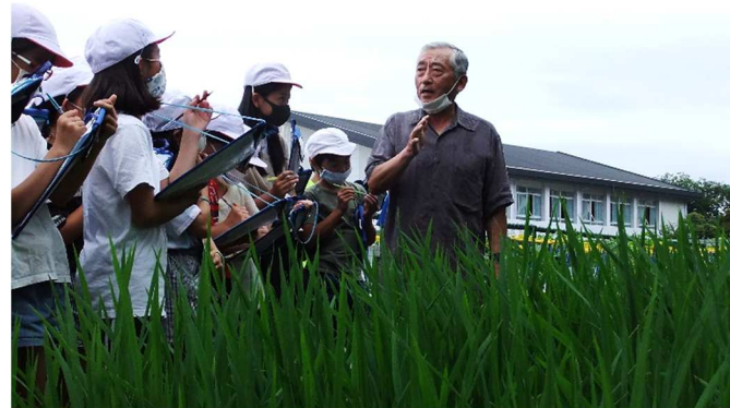
【ミニ水田で学ぶ5年2組の子供たち】