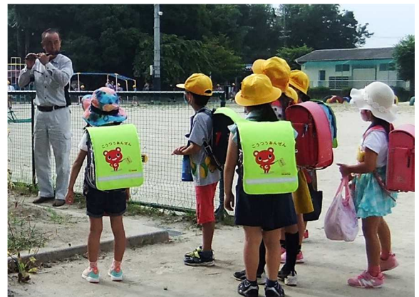
【昇降口での龍笛の演奏】