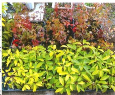
くすくん(上)とカエちゃん(下)の苗

なお、カエちゃんの苗は、芽を出して初めての冬を迎えています。季節を感じていて、小さくても、その葉はきちんと紅葉してとてもきれいです。