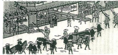
大名行列(上)と 本陣跡碑(伝馬通1)

江戸時代の伝馬町には宿泊施設が整えられ、諸大名をはじめとして多くの人々の宿泊と往来でにぎわいを見せていました。たくさん の 宿屋が集まっていたため、この町は旅籠屋町とも呼ばれていました。その中で、公用旅行者のための宿泊施設があり、それを本陣と脇本陣と言われました（右は西本陣跡碑）。