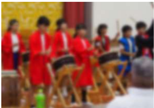
【敬老会アトラクション: 和太鼓の演奏】