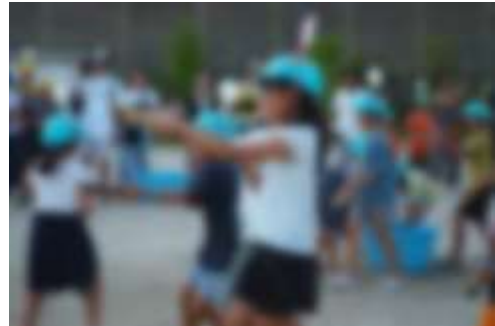
常磐南学区敬老会