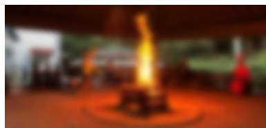
【キャンプファイヤー】

山の学習で二つのことが心に残っています。一つ目は、キャンプファイヤーです。静かなときと楽しむときのメリハリをつけて行いました。二つ目は、カレー作りです。私は食事係だったので、野菜を洗ったり、切ったりしました。片付けはさすがになかとなれなくて苦労しましたが、みんなで助け合って洗ったら、きれいになったのでうれしかったです。山の学習で学んだことを、これからの学校生活に生かしたいです。