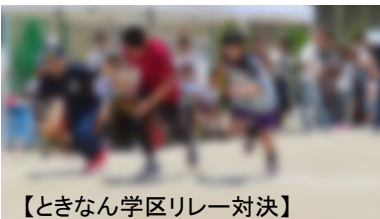
【ときなん学区リレー対決】