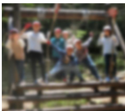
【フィールドアスレチック】