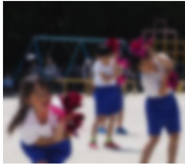
【1・2年 まほうをかけちゃえ ときなんカーニバル】

ほんばんのダンスは、おおきなこえがでて、えがおでおどれたよ。さいごまでがんばってれんしゅうしてきたダンスは、たのしかったよ。おかあさんが、「がんばったね」と、いつてくれたので、すごくうれしかったよ。