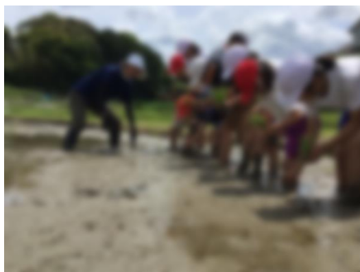
【6年生と一緒に初めて田植えをする1年生】

今年に入って、学校田で田植えの準備をしてくれている地域の方を見ました。地域の方のおかげで田植えができていますと感じました。