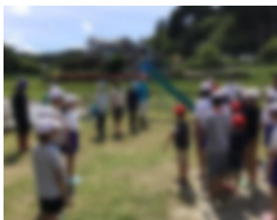
【全校田植え 開会式】

ぼくは、田うえで足がどろだらけになりました。どろの中はぬるぬるしていてカエルがいっぱいました。どろは足について、おもりみたいにおもたくてうごきにくかったです。先生にもらったなえを三つに分けて、田んぼに上手にうえることができました。ちゃんとなえが元気にそだつといいなとおもいました。