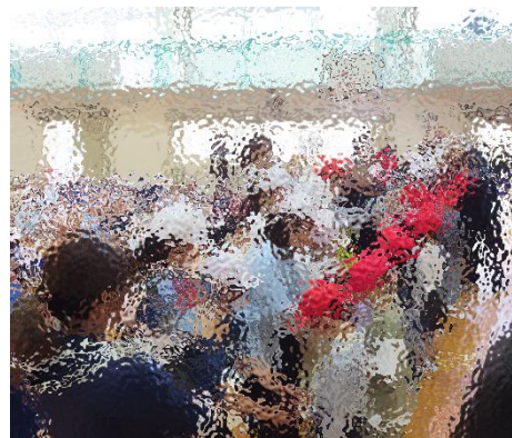
【メダルのプレゼント】