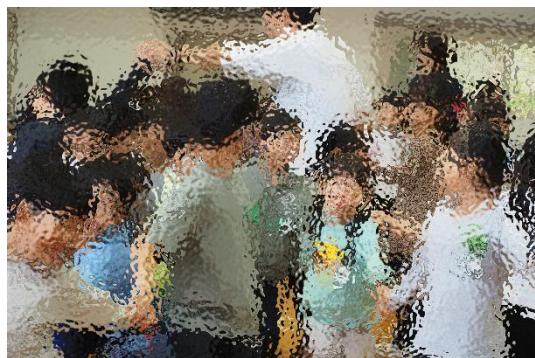
【2年生と「なべなべそこぬけ」で遊ぶ1年生】

なかよし会では、ゲームと学校たんけんをしました。ゲームでは、一年生みんながたのしそうにしてくれて、とてもうれしいきもちになりました。学校たんけんでは、学校のいろいろなばしよやルールをおしえました。これから一年生がこまっていたら、やさしくたすけたいです。