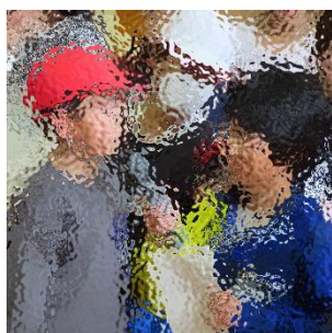
【1年生ヘインタビュー】

いちねんせいをむかえるかいで、ろくねんせいからめだるをもらいました。くびにかけてもらったとき、とてもうれしかったです。おもいでがつまっためだるになりました。