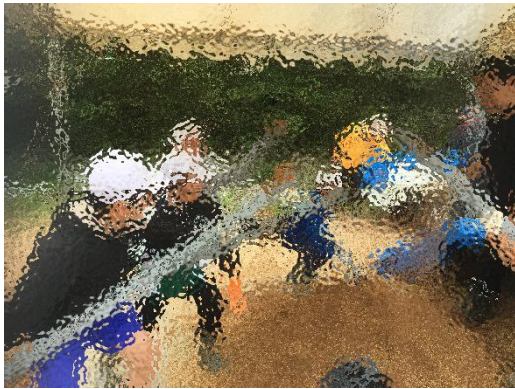
【パイプに赤土を入れる6年生】

植え付けは、○○さんや○○先生がいてねいに教えてくださったおかげで、順調にできました。これからも感謝の気持ちをもって、自然薯の生長を見ていきたいです。