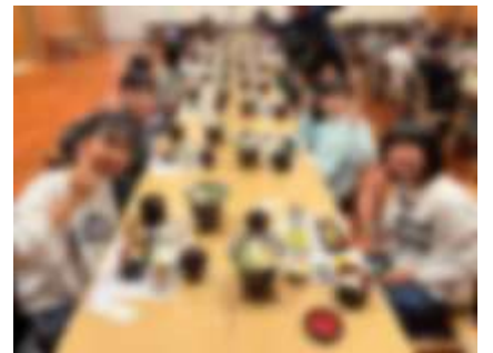
【旅館での夕食タイム】

舞妓さん、初鑑賞 六年 旅館で舞妓鑑賞をしました。舞妓さんは舞をするとき、顔はずっと真剣な表情のまま、手やひざ、足の動きで気持ちを表現していると知りました。また、自分で顔や背中に化粧をしていると聞き、すごいと思いました。最後に「お座敷遊び」をしました。私は、家族と一緒に座敷遊びをしたことがあるけれど、比べものにならないくらい上手でした。私は、舞妓さんに興味をもっていたので、舞妓さんになってみたいと思いました。