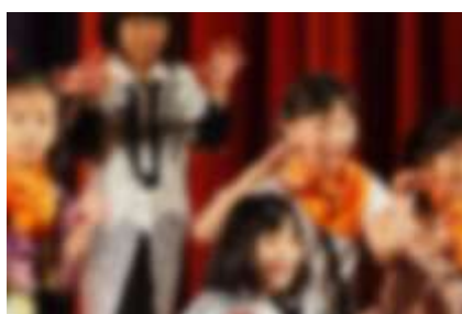
【3年: ヒュードロンお化け学校】

はじめての学げい会は、とても楽しかったけれど、せりふをおぼえるのは大へんでした。練習が始まると、せりふを言うだけでなく、身ぶり手ぶりを付けて言った方がよいと分かり、動きをくふうしました。お化けの子と人間の子が本当になかよくなりましたように見える動きを考え、表現できましたがうれしかったです。四年生でも、動きをつけてえんじることがんばりたいと思います。