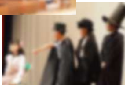
【5年2組: トラブル・メーカー】

ぼくは、執事役を演じました。執事は、一つの役を二人で演じます。学芸会本番でもう一人の執事役の人が