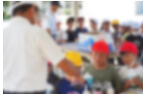
【かき氷のシロップ、何にしようかな】