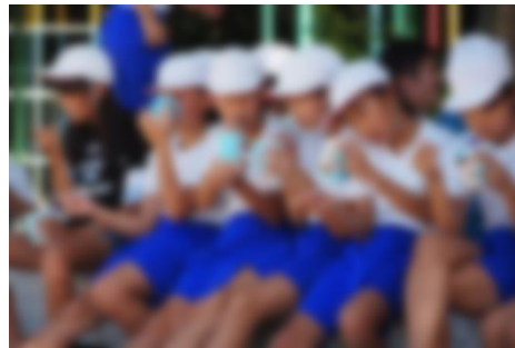
【みんなで一緒にかき氷】

した。教室で順番をまつ間、まだよば れないかな、早く食べたいな、とまち きれない気持ちでいっぱいでした。 今年はいちごとスカイブルーのミ ックスを食べました。色はむらさき 色です。あまくてとてもおいしかっ たので、また食べたいです。暑い日 につめたいかき氷をみんなと食べる ことができて最高でした。