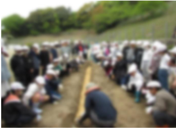
【〇〇さんの説明を聞く子どもたち】

自然薯の植え付けはつかれたけど、楽しかったです。去年の長さをこえるくらい大きくなってほしいです。