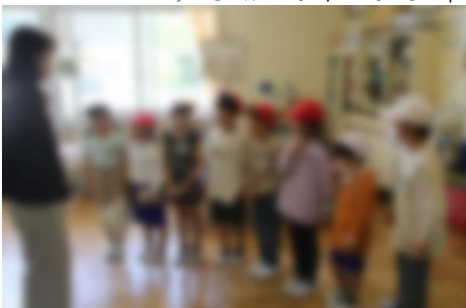
【保健室を案内する2年生】

一年生と二年生でなかよしかいをしました。ぼくは、さいしよのしかいをしました。きんちようしましたが、上手にせりふをさいごまでいうことができました。学校たんけんでは、一年生と手をつないであんないをしました。一年生がたのしいといってくれてうれしかったです。これからもやさしくしてあげたいです。