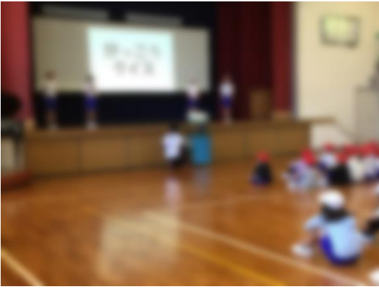
【スマイルリーダー企画「がっこうクイズ」】

私たちスマイルリーダーは一年生を迎える会の企画運営をしました。一年生に喜んでほしくて、この会を行うまでに委員会の時間だけでなく、休み時間も一生懸命準備をしました。会が始まると、私たちが考えたレクを全校のみんなが楽しそうにやっています。緊張していたけれど、みんなの姿を見て、私も自然と笑顔になりました。 スマイルリーダーみんなが協力したり、友達みんなが支えてくれたりしたおかげで、最高の一年生を迎える会になりました。とてもうれしくなりました。