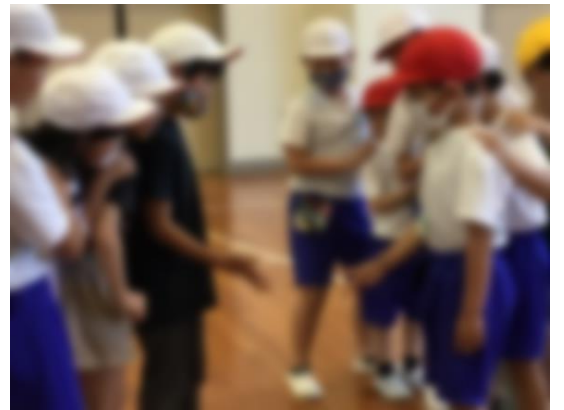
【全校児童でじゃんけん列車】