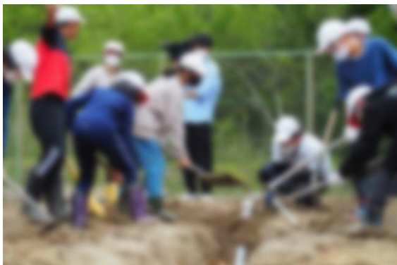
【パイプの埋め込みをする6年生】

ぼくは、六年生になって初めてパイプに赤土を入れました。パイプに赤土を入れると、どんどん重くなっていきました。去年の六年生も同じような作業をしていたと分かり、驚きました。自然薯の植え付けでは、〇〇さんの話をしっかり聞き、みんなが一つ一つ丁寧にパイプをうめたり、マルチに土をかぶせたりしました。これから六年生が自然薯のお世話をがんばるので、大きく成長して