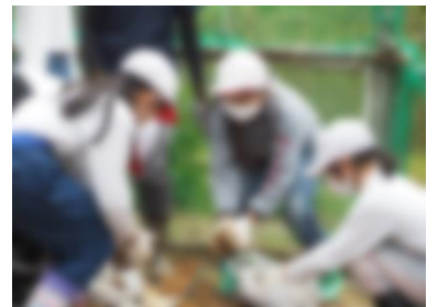
【赤土を補充する5年生】

自然薯を植え付けるのは、初めてで不安だったけれど、楽しくてよかったです。来年も楽しく自然薯の植え付けをしたいです。