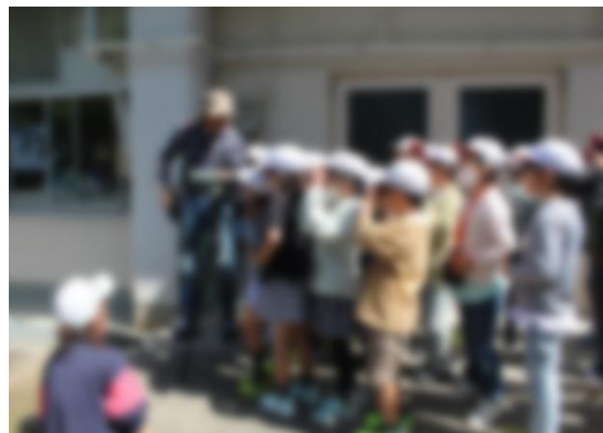
【3年:バードウォッチング】