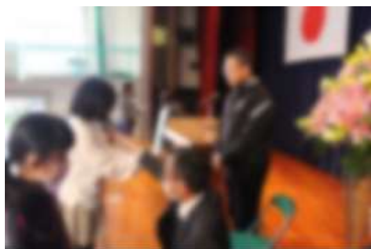
【退任式：お別れの手紙】

常南は美しく、常南っ子はやさしい。そんな姿が永遠に続くことを心から願っています。