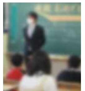
【子どもたちと共に】

「ありがとう ありがとう いえば とつてもいきもち ありがとう ありがとう いわれりや もつといきもち ありがとう ありがとう この学校が「ありがとう」いっぱいの学校になりますように!