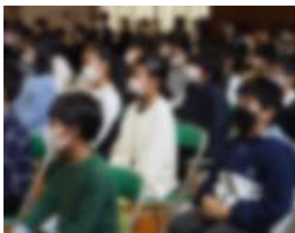
【真剣に話を聞く高学年の子どもたち】

最後になりますが、常磐南小は、「力いっぱい」が合言葉です。勉強、運動はもちろん、あいさつも力いっぱいして、一緒に明るく元気な常南を作っていきましょう。そして困ったときはわたしたちに気軽に声をかけてください。みなさんの活躍を心から応援します。