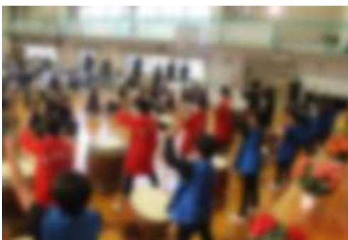
【入学式:歓迎の和太鼓の演奏】