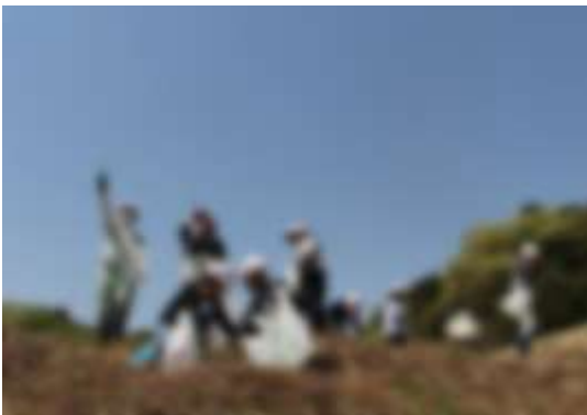
●今年も〇〇さんが常南っ子のために準備してくださったおかげで、たくさんわらびを収穫することができました。ありがとうございました。

自分たちでとったわらびで、初めてわらびごはんを作りました。まず、〇〇さんの家の近くへ行き、わらびをとりました。短いのもあれば、長いものもあります。行くだけでも楽しみを感じましたが、友達がいっしょなので、わくわくどきどきが止まりませんでした。次は、料理です。油あげとわらびを切りました。わらびは、くきのかたい部分を取ってから、三センチくらいに切りました。自分たちで食べるとなると、とても楽しみになりました。給食の時間、わらびごはんを食べました。とてもおいしかったです。がんばって作ってよかったです。