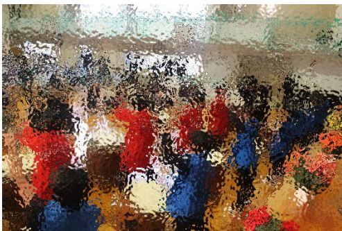
【入学式: 歓迎の和太鼓の演奏】

「ありがとう」 ありがとう ありがとう ありがとう ありがとう ありがとう ありがとう ありがとう ありがとう 「この学校が「ありがとう」いっぱいの学校になりますように！」