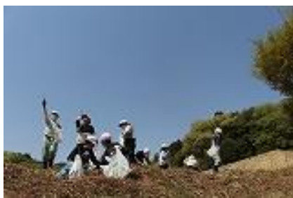
●今年も〇〇さんが常南っ子のために準備して下さったおかげで、たくさんのわらびを収穫することができました。ありがとうございました。

自分たちでとったわらびで、初めてわらびごはんを作りました。まず、〇〇さんの家の近くへ行き、わらびをとりました。短いのもあれば、長いのもあります。行くだけでも楽しみを感じましたが、友達がいっしょなので、わくわくどきどきが止まりませんでした。次は、料理です。油あげとわらびを切りました。わらびは、くきのかたい部分を取ってから、三センチくらいに切りました。自分たちで食べるとなると、とても楽しみになりました。給食の時間、わらびごはんを食べました。とてもおいしかったです。がんばって作ってよかったです。