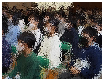
【真剣に話を聞く高学年の子どもたち】

最後になりますが、常磐南小は、「力いっぱい」が合言葉です。勉強、運動はもちろん、あいさつも力いっぱいして、一緒に明るく元気な常南を作っていきましょう。そして困ったときはわたしたちに気軽に声をかけてください。みなさんの活躍を心から応援します。