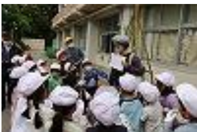
▲種について説明する講師の〇さん

二年生の学級園が、リニューアルしました。学区の〇〇さんと〇さんが、デザインし、整備してくださったおかげで素敵な畑になりました。きゅうりと落花生の場所は秘密基地、十六ささげとみつばの場所はトンネルです。ヘチマは、緑のカーテンになります。竹や廃材などを使い、地球を大切に願う畑になっています。そして、ふかふかの腐葉土に十種類の種を蒔きました。