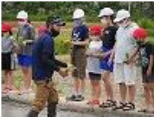
▲苗の分け方を説明する講師の〇さん

十二日に田植えをしました。去年は田植えができなかったもので、今年はできて本当によかったです。開会式の後、二年生と田んぼに入りました。入った瞬間、とてもどろどろしていて気持ち悪かったです。でも、だんだん慣れてきました。苗を植えるときは後ろ向きに進んでいくので、どろに足をとられて動きにくかったです。苗は目印に合わせて植えることができました。いつもより長い時間、植えられて楽しかったです。夏休み明けの稲かりも自分たちでやりたいし、また来年もみんな田植えができるといいなと思います。