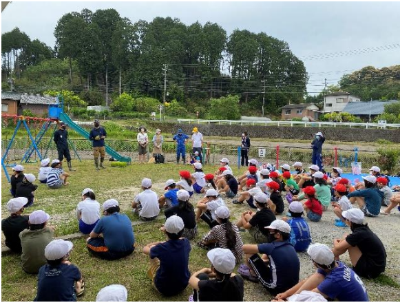
▲全校田植えの会 開会式

田植えが始まると、いつの間にか落ち着き、周りの人の様子を見られるようになりました。そこで気付いたことがあります。それは、六年生のペアに対する接し方のうまさです。うまく歩けない一年生に手を貸したり、優しく声をかけてあげたりして、すごいなと思いました。ぼくもそうしたいと思ったのですが、何度も転んでしまい、上手にできなかったので、来年はリベンジしたいと思いました。