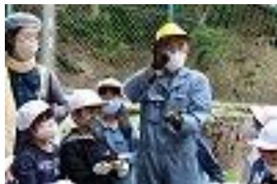
▲カブトムシの話をする講師の〇〇さん