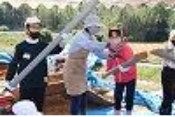
▲クレバーパイプに赤土を入れる方法を教える○○さん