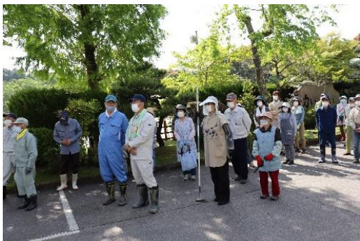
▲奉仕作業に集まってくださった福寿会の皆様

去る五月八日(土)、福寿会の皆さんによる奉仕作業が行われました。この日は天気も良く、暑い中での作業となりましたが、六十名近くの皆さんが、参加してくださいました。運動場の周りや花壇、学校坂から市民ホーム周辺まで、細かい草を抜いたり、草刈り機で刈り取ったりしていただきました。福寿会の皆さん、ありがとうございました。