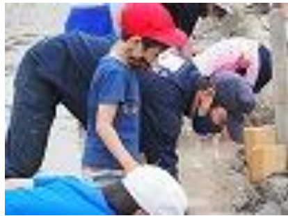
▲苗の植え方を教える講師の○○さん

二つ目は、ペアの二年生にしっかりと教えることができたことです。「苗は三〜四本ずつに分けて植えるよ」「人差し指の第一関節くらいまで植えるよ」とやさしく伝えることができました。私もペアの子も楽しく田植えに取り組むことができました。