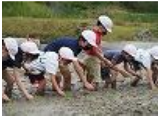
▲ペアになって真剣に田植えをする2年生と5年生

今回の田植えで一番心に残っていることは、六年生といっしょに田植えをしたことです。これまでは、田植えといっても少し植えたら終わってしまっていて、物足りないと感じていました。今年は高学年が中心となって活動したので、長時間苗を植え続けることができ、じゆう実した時間を過ごせました。こんなにわくわくしたのはひさしぶりの感覚です。どろの中に入ると、楽しいだけでなく、どろがついてよごれたり、石をふんで痛かったりと田植えならではの気付きがたくさんありました。この経験を忘れず、来年も田植えに取り組みたいです。