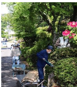
▲学校坂の樹木等の整備