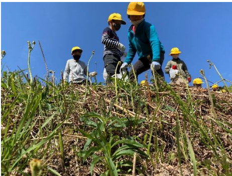
▲ わらびを採る3年生

ぼくは、わらびをとりました。何本とったかというと、五十一本とりました。わらびは、葉が出ていないと固いそうです。葉が開いていないのがおいしいと教わったので、開いていないものを探しました。来年もわらびをたくさんとりたいたいです。