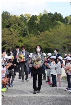
▲退任式で児童の見送り

約半年間、お世話になりました。年度途中からの赴任でわからないことが多い中、優しい皆さんはたくさんのお話を教えてくれました。皆さんと過ごした時間は、とても温かく今でも心に残っています。これからも心と体を大切にしてい、成長していつてくださいます。離れてもずっと応援しています。