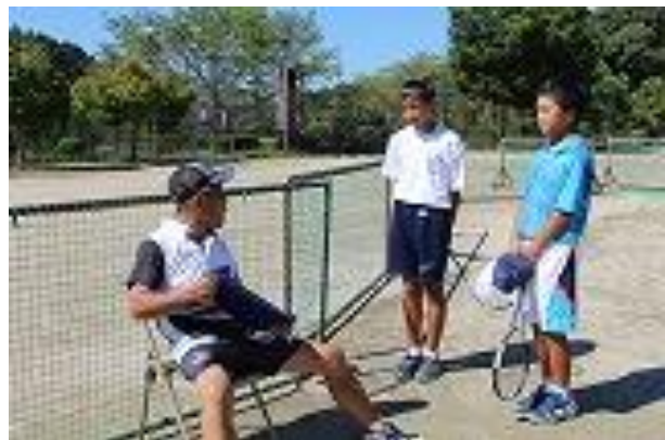
▲練習試合で常中生を指導する○○○さん

実は、○○○さんの指導は、土日に限るものではありません。毎週水曜と金曜の夜七時から九時まで、常磐テニスクラブと称して、主に中学生約三十人を指導しています。もちろん