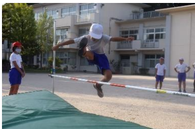
▲陸上部高跳びの練習

わたしの種目は八十メートルハードルです。スタートと跳びかたの練習を意識して取り組んでいます。最高記録が出せるように練習を精一杯取り組みたいです。また、自分だけではなく、一緒に練習をする仲間と競いながら努力していきたいです。