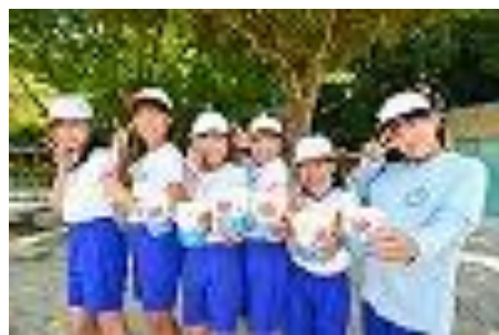
▲かき氷を食べる子どもたち

みんなの笑顔がたくさん見られた会でした。最近マスクをつけていて、表情が分からないことが多かったのですが、笑顔がより輝いていました。暑い中だったし、冷たいものを食べることでできてうれしかったです。