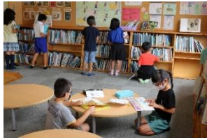
▲読書週間の図書室

ぼくがおすすしたい本は『だじやれどうぶつえん』です。どうぶつのだじやれと絵がとも分かりやすく、読みおわると、えがおになれます。だれとも楽しく読めるので、ぜひ読んでみてください。