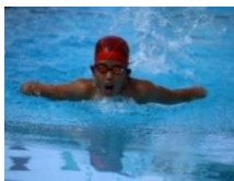
▲バタフライを泳ぐ主将の○○○君