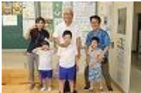
・一組担任 ○○ ○○ 級訓 夢 ・二組担任 ○○ ○○ 級訓 ゆっくり ゆっくり 一歩ずつ ・三組担任 ○○ ○○ 級訓 いっぱ