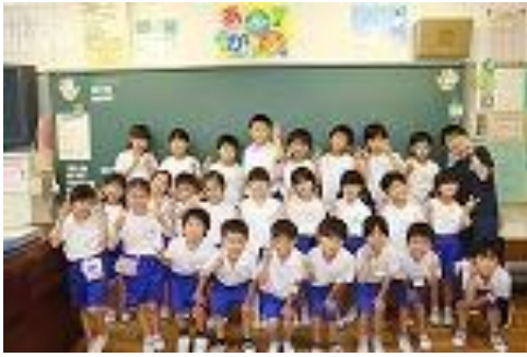
・担任 〇〇〇〇〇 ・級訓 あさがお

〇〇〇〇〇〇 わたしはこのクラスのことをやさしいクラスだと思っています。なぜかというとうと、わたしがころんでしまったときに、「だいじょうぶ？」とみんながやさしく声をかけてくれたからです。わたしもやさしくしていきたいです。