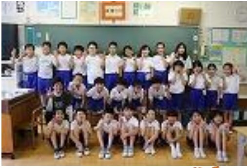
・担任 ○○ ○○ ・級訓 スマート

わたしのクラスは、元気いっぱいの子が多いです。だから楽しいことも多いけど、ぶつかり合うことも度々あります。四年生になったので、もう少し落ち着くとこは落ち着いて、元気を出すときは元気いっぱい、いっしょけんめいがんばれる、めりはりのついたクラスにしたいです。理想のクラスに向けて、みんなで意識して生活していきたいです。