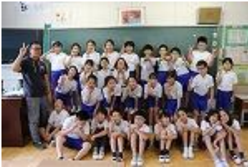
・担任 ○○ ○○ ・級訓 ・LOVE & PEACE

入学してから一度もクラス替えのない五年生は、とても友達思いなクラスです。誰かが転んだときに「大丈夫？」とやさしい言葉をかけてくれます。こんなやさしい子が増え、やさしくて明るいクラスになってほしいです。