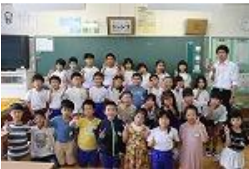
・担任 〇〇〇〇〇 ・級訓 ジャンプ