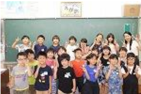
・担任 〇〇〇〇〇 ・級訓 えがお