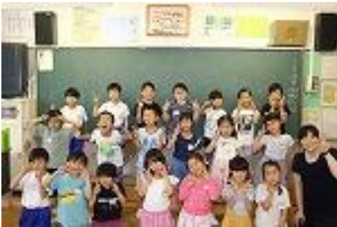
・担任 〇〇 〇〇 ・級訓 カラフル