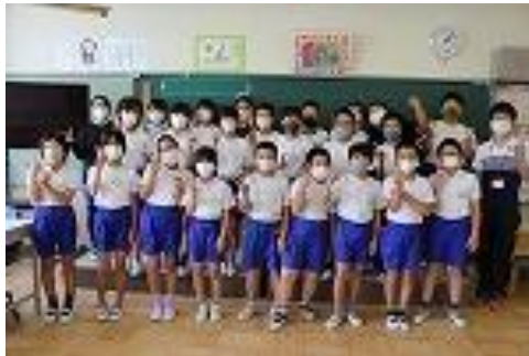
・担任 ○○ ○○ ・級訓 COLORS

わたしのクラスはいつも笑顔で元気いっぱい입니다。一年生のころからずっと同じメンバーなのでとても仲がいいです。先生に仕事を頼まれたら精一杯行うことができます。国語や道徳の授業では皆さんの意見を書くなど、どの授業もとても頑張っています。