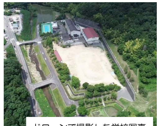
ドローンで撮影した学校写真

私たち、教職員も、教師としての自覚をもち、児童が安心して充実した学校生活を送れるよう、一丸となって取り組んでまいります。どうかよろしくお願ひします。