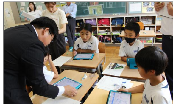
タブレットを活用してクローバー学習を進めます