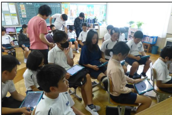
「夢への挑戦」と題したお話をお聞きました