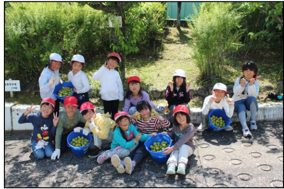
1・2年生、写真の納まり方を知っていますね