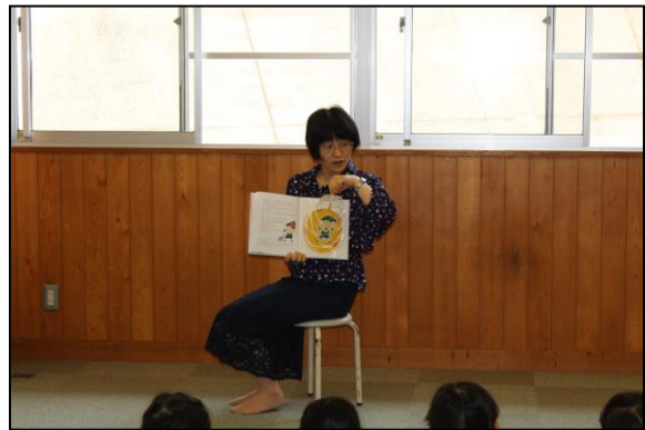
心の中には、にこにご笑顔が隠れていました