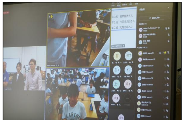
他校とも映像をつなぎ、学びを深めました