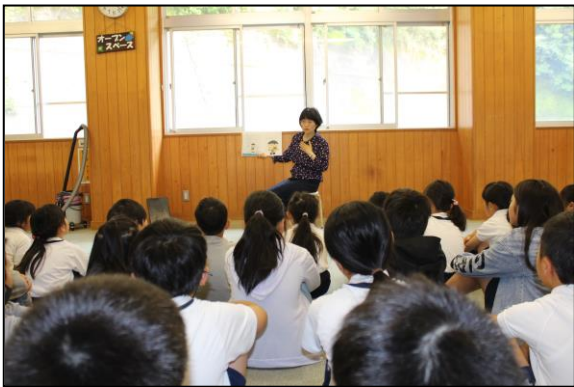
全校の目が一斉に校長先生に注がれます