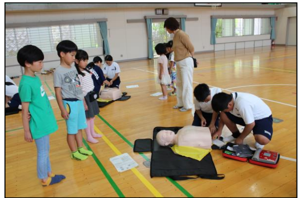
下学年が5・6年生の様子を見に来ました