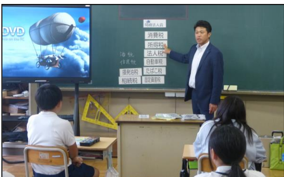
税金の種類やその中身について学びます