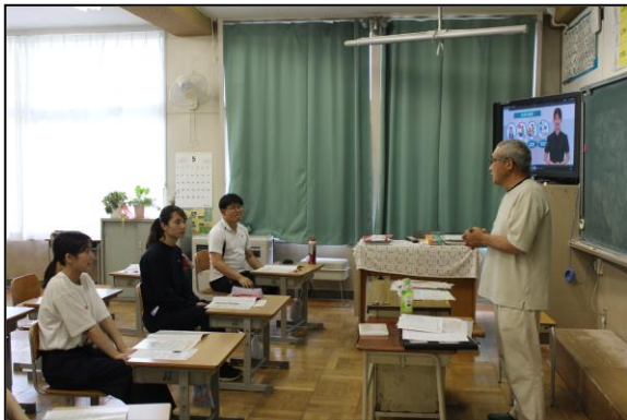
職員版は理論も含めた、3時間の講習です