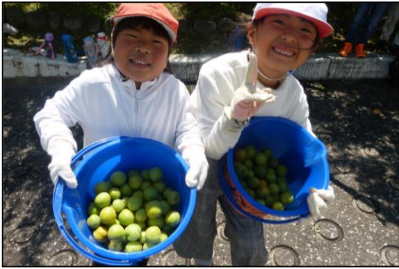
たくさん取れたね、満足そうな表情が素敵です