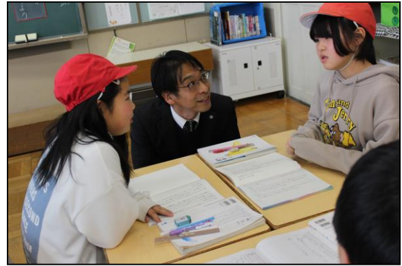
中学校の先生に授業の様子を見ていただきました