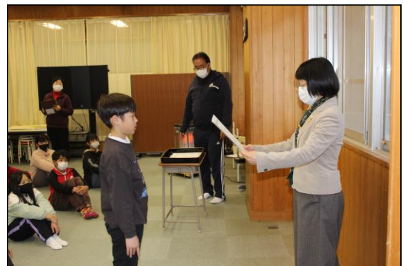
受賞者の皆さん、おめでとうございます