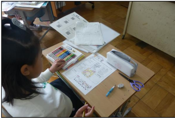
生活科の授業で、自分の成長を振り返ります