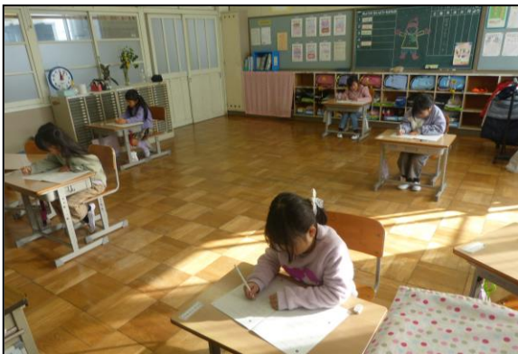
1年間の学習における定着の度合いを確認します