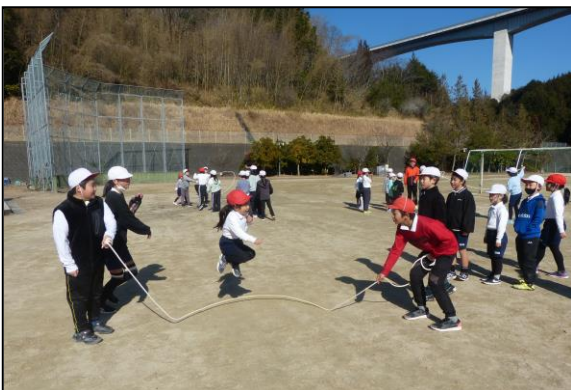
回し手の優しさを感じる写真です、素晴らしい