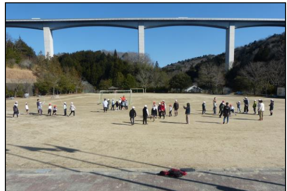
どのグループも記録の更新をめざして真剣です