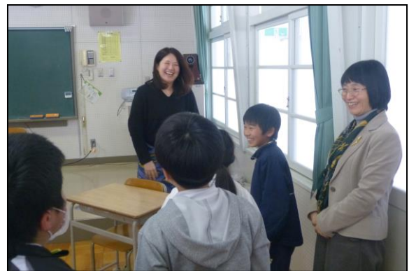
授業の後には、たくさん質問することもできました