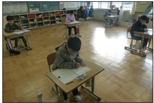
制限時間をフルに使って問題を解いています