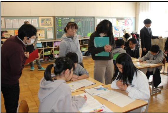
どんなロボットが必要かグループで話し合いました