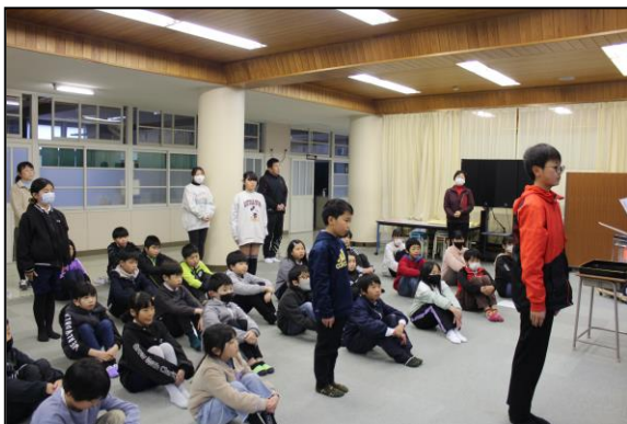
感想文や書き初めなど多くの表彰がありました