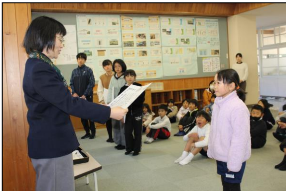
最初に作文やポスターの表彰が行われました