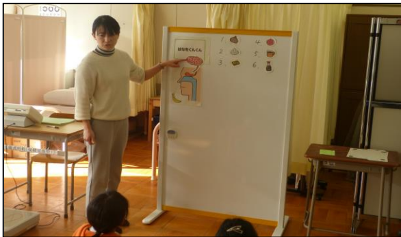
今回のテーマは鼻の働きについて