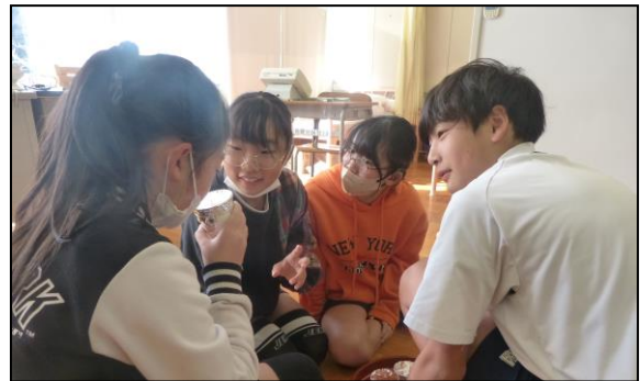
体験的な活動も交え、鼻の役割を学びます