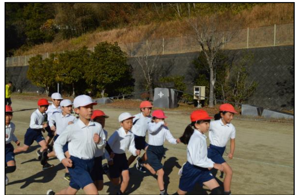
中学年、一丸となって周回道路へ向かいます