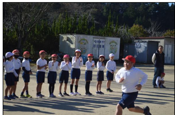
走者を後押しする力強い声援、これが素晴らしい