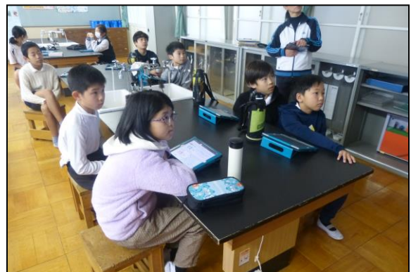
画面に食い入るようにお話を聞く子供たち