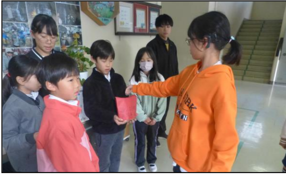
代表委員の子供たちが活動をリードしてくれました

本年度も赤い羽根共同募金を行わせていただきました。全校で、6,550円の募金が集まりました。ありがとうございました。このお金は愛知県共同募金会を通じて、お年寄りの見守り活動や、障がいのある方、生活困窮者の方、子供たちへの支援、福祉活動を行うNPO法人やボランティア団体などさまざまな福祉課題解決のために役立てられます。また、災害時には、被災地や被災者の方々を支援します。