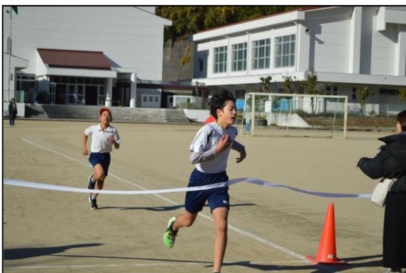
高学年、ゴール前まで続いた熱い勝負