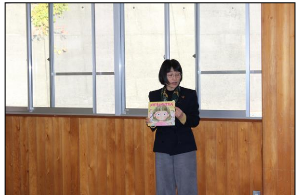
校長先生が人権に関する絵本を紹介してくれました