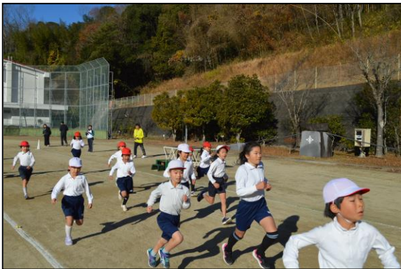
低学年、みんな一心不乱にゴールを目指します