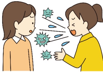
ひまつかんせん 飛まつ感染